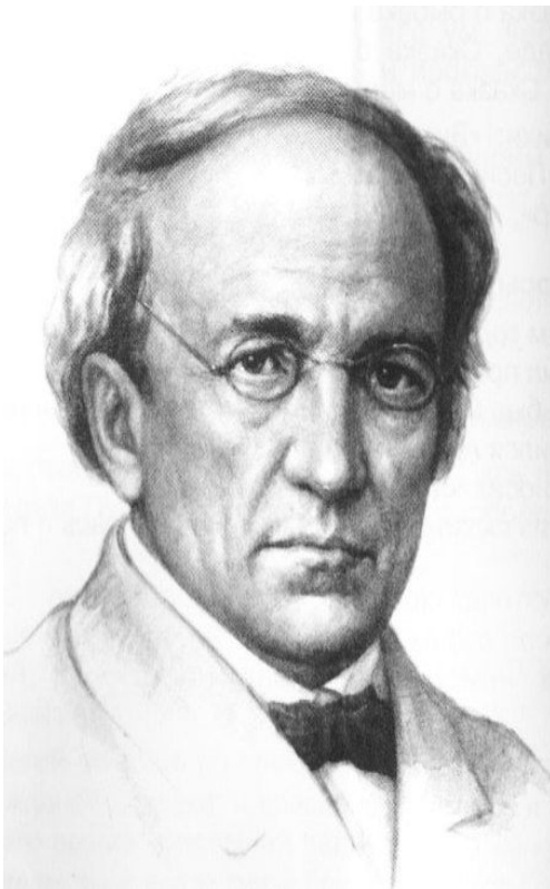
Ф. И. Тютчев