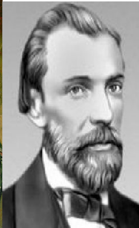
И. С. Никитин