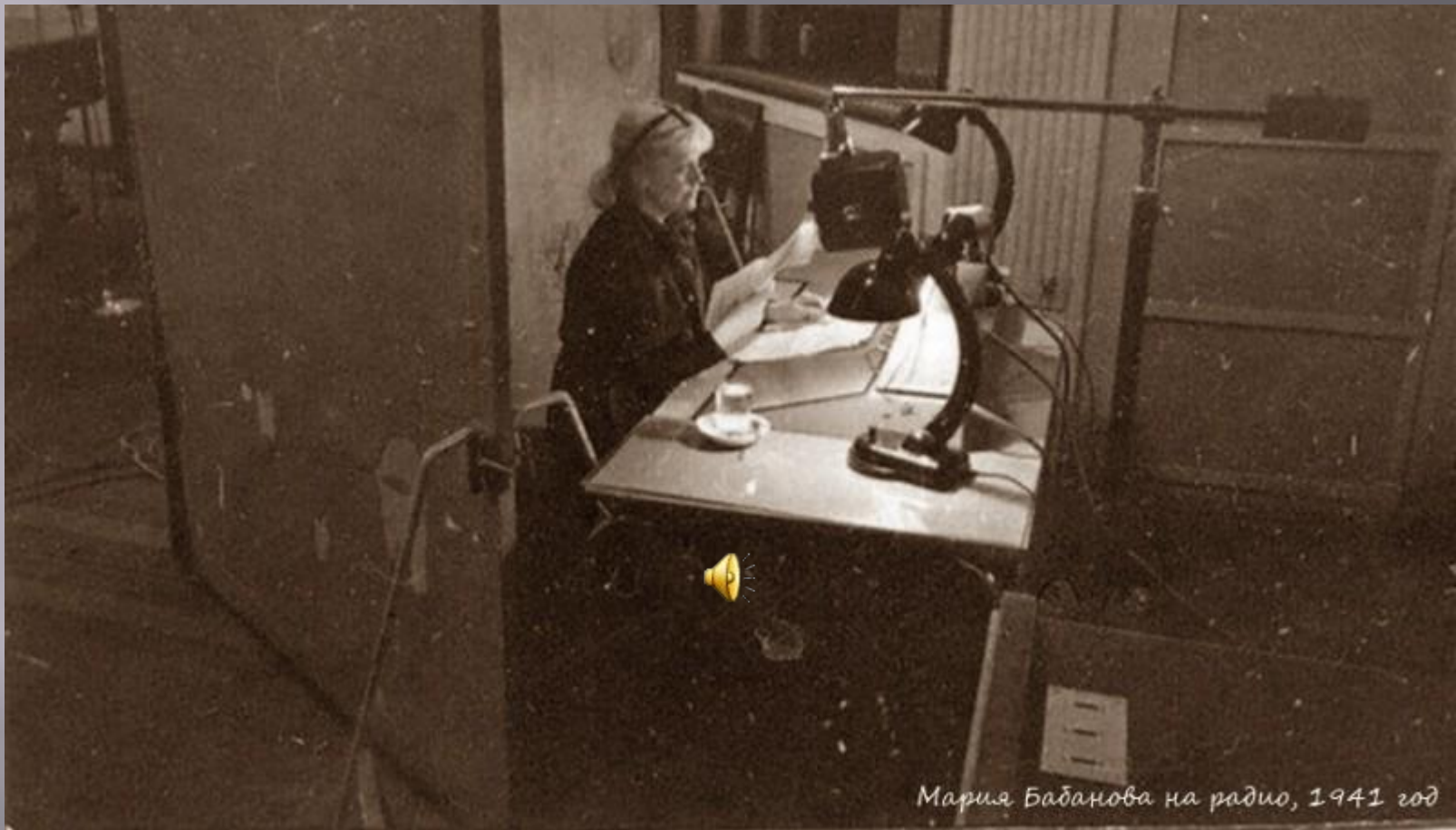
Мария Бабанова на радио, 1941 год

Премьера пьесы «Давным-давно» пришлась на первые месяцы Великой Отечественной войны: в августе 1941 года вышла ее радиопостановка с участием популярных артистов Марии Бабановой и Сергея Мартинсона.