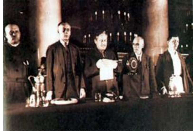
Председатель Верховного суда А. Вышинский оглашает приговор по "шахтинскому делу"