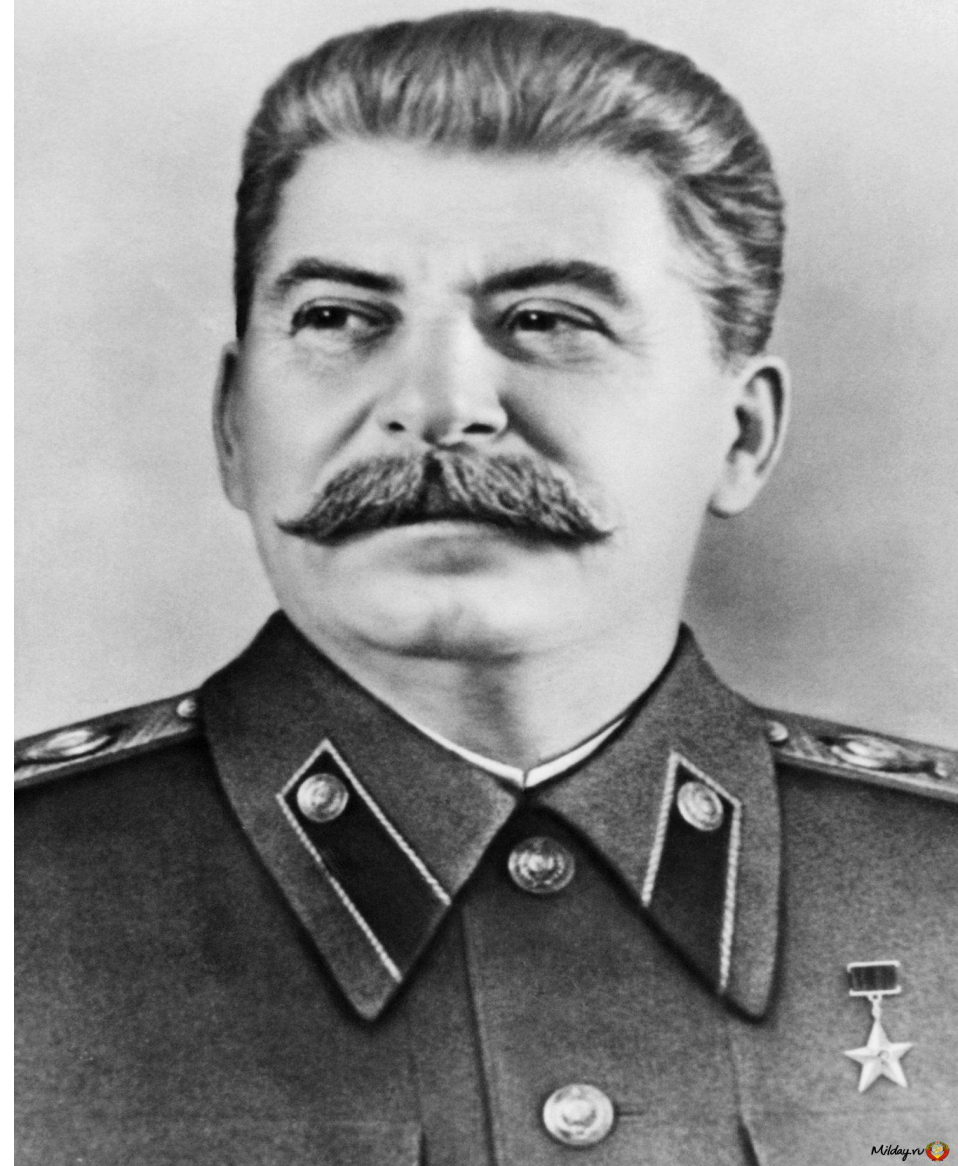
Й. В. Сталін