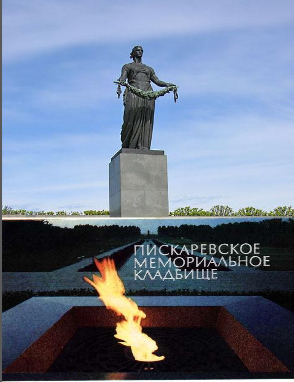
Мемориал на Пискаревском кладбище