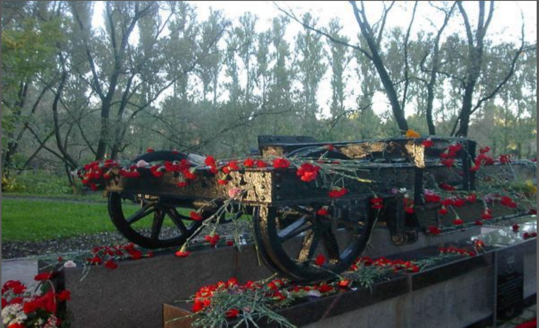
Памятник жертвам Блокады Ленинграда