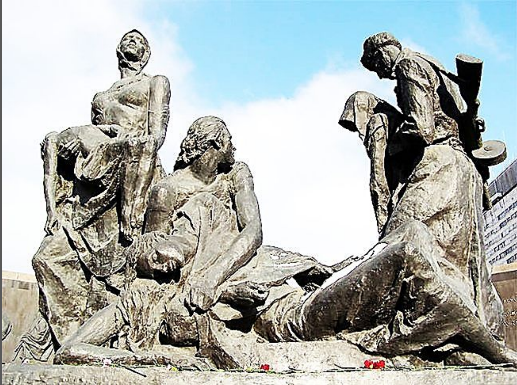
Памятник героическим защитникам города на площади Победы