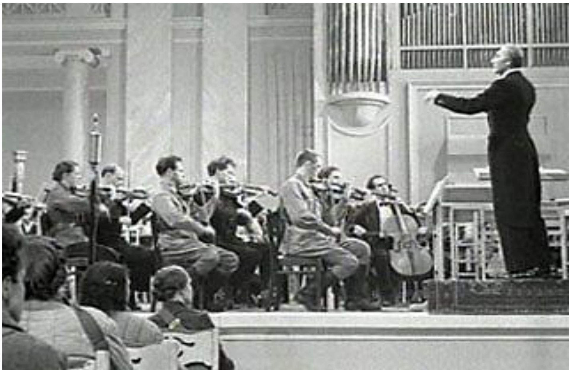
Седьмая симфония Дмитрия Шостаковича звучит в зале Филармонии.