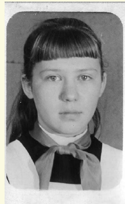
ОКТЯБРЕНОК - ПИОНЕРКА - КОМСОМОЛКА