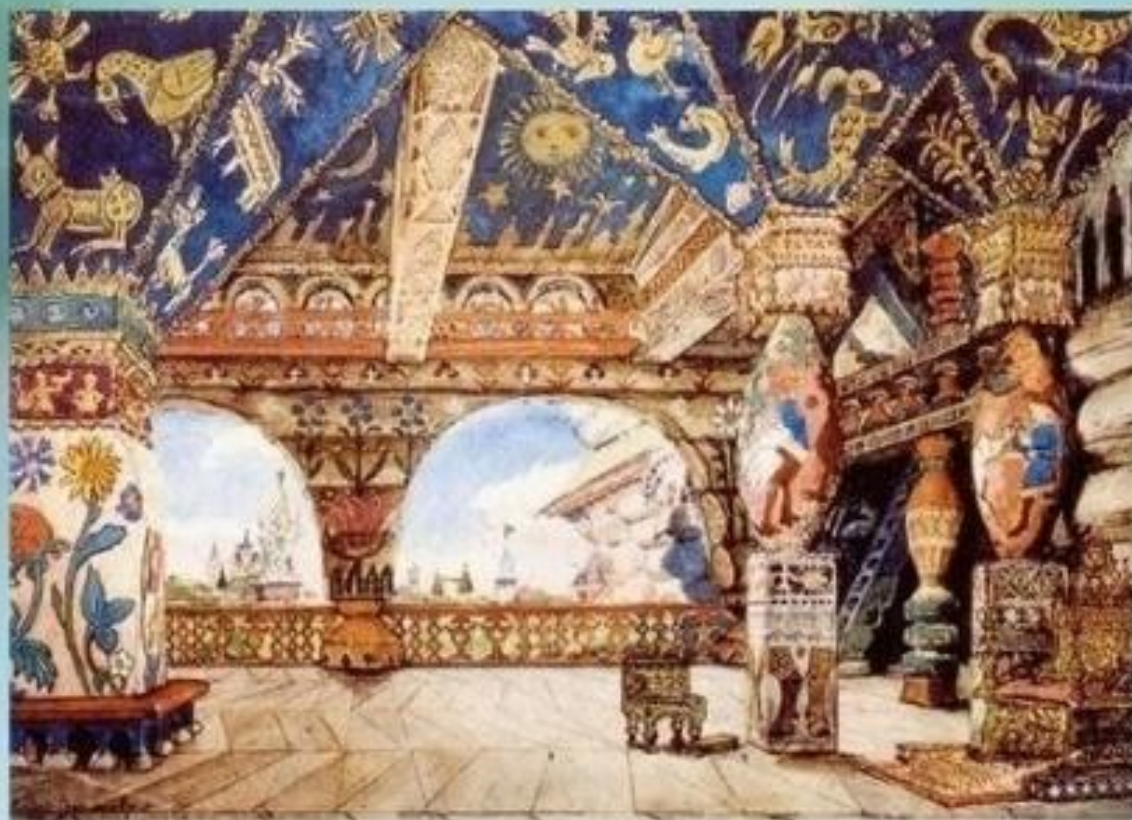
В.М. Васнецов. "Палаты цари Берендей". Эскиз декорации к опере Н.А. Римского-Корсакова "Снегурочка". 1885 г. Третьяковская галерея

Опера сочинялась летом 1880 года в глухой русской деревне. Композитор говорил впоследствии, что ни одно произведение не давалось ему с такой легкостью и быстротой, как «Снегурочка».