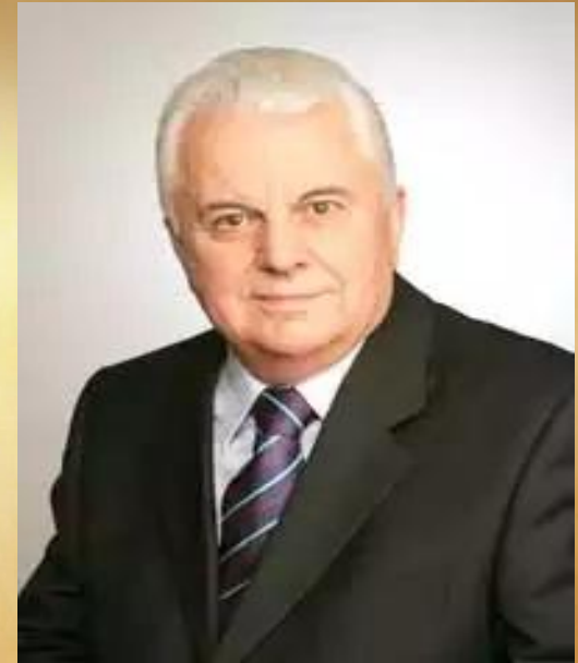
Леонід Мака́рович Кравчу́к