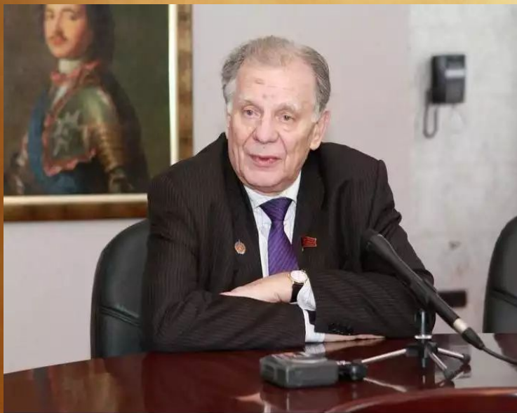
Жорес Ива́нович Алфе́ров

В 1990-е годы, финансирование науки сократилось. За этот период Россия пережила самую масштабную утечку высококвалифицированных научных кадров за свою историю, в результате которой из страны уехали от 100 до 250 тыс. ученых.