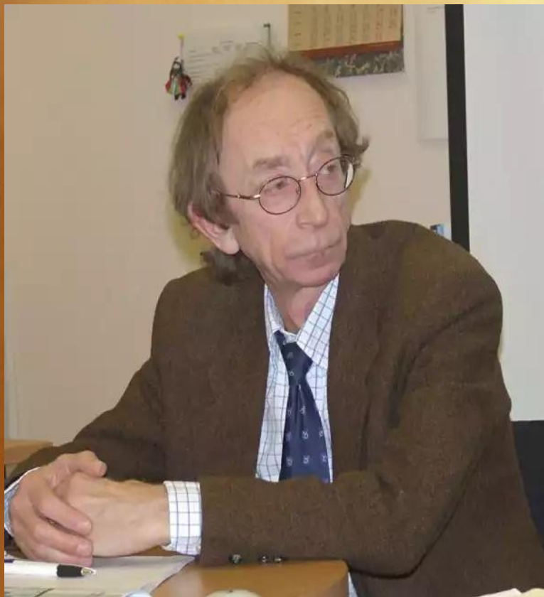
Владимир Изявич Мукомель

В последние годы существования СССР на его территории был активно использован потенциал межнациональных конфликтов. После его распада большинство из них немедленно перешли в фазу вооружённых столкновений. По данным Владимира Мукомеля, число погибших в межнациональных конфликтах в 1988—96 годах составляет около 100 тыс. человек. Число беженцев в результате этих конфликтов составило не менее 5 млн. человек.