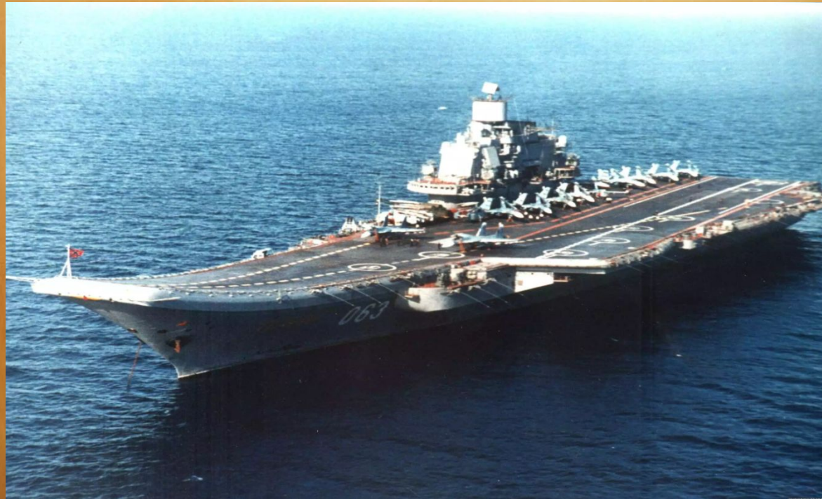
Авианосец Адмирал Кузнецов