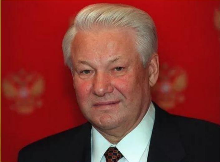
Борис Николаевич Ельцин