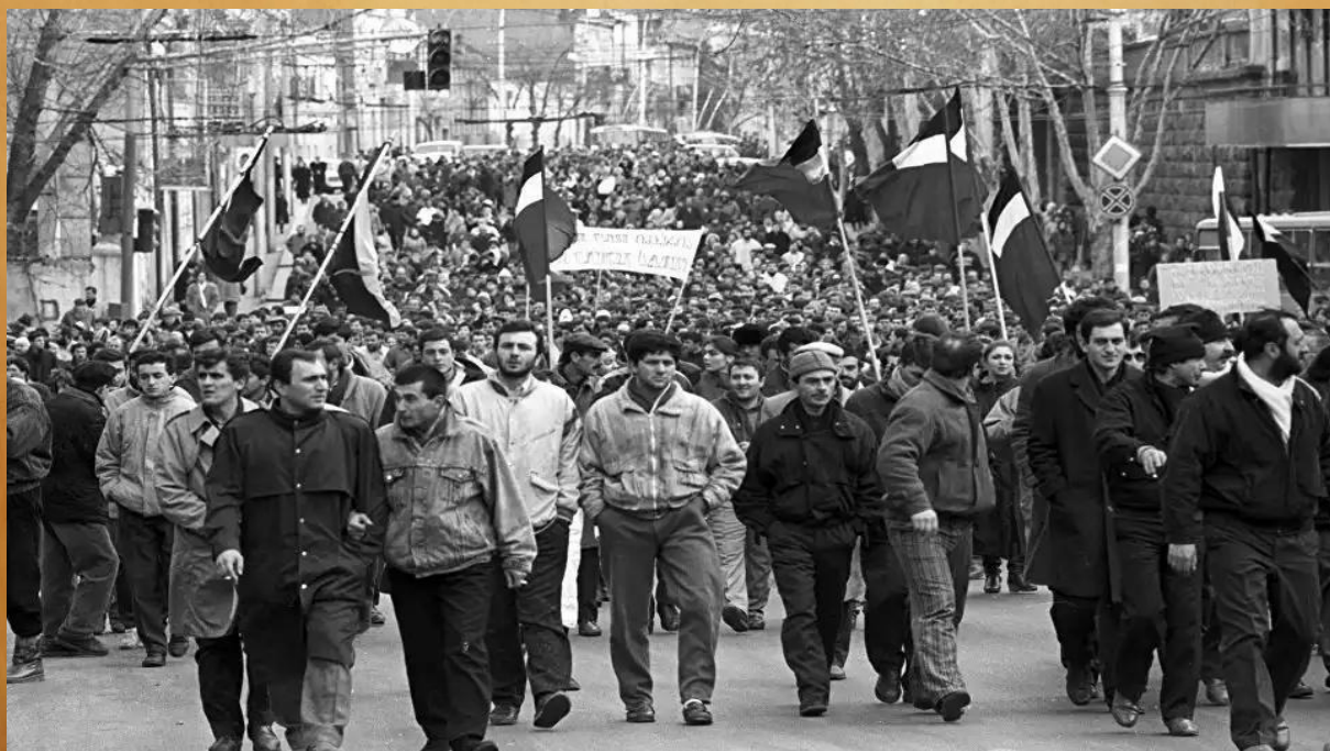
«Парад суверенитетов» 1990 г.

Национальные элиты были по экономическим, политическим, личным мотивам заинтересованы не столько в сохранении СССР, сколько в его распаде. «Парад суверенитетов» 1990 г. ясно показал настроения и намерения национальных партийно-государственных элит.