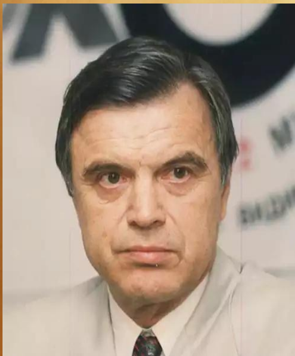
Руслан Имранович Хасбулатов