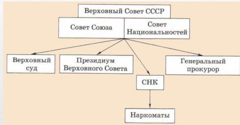
Судебная система СССР по Конституции 1936 года