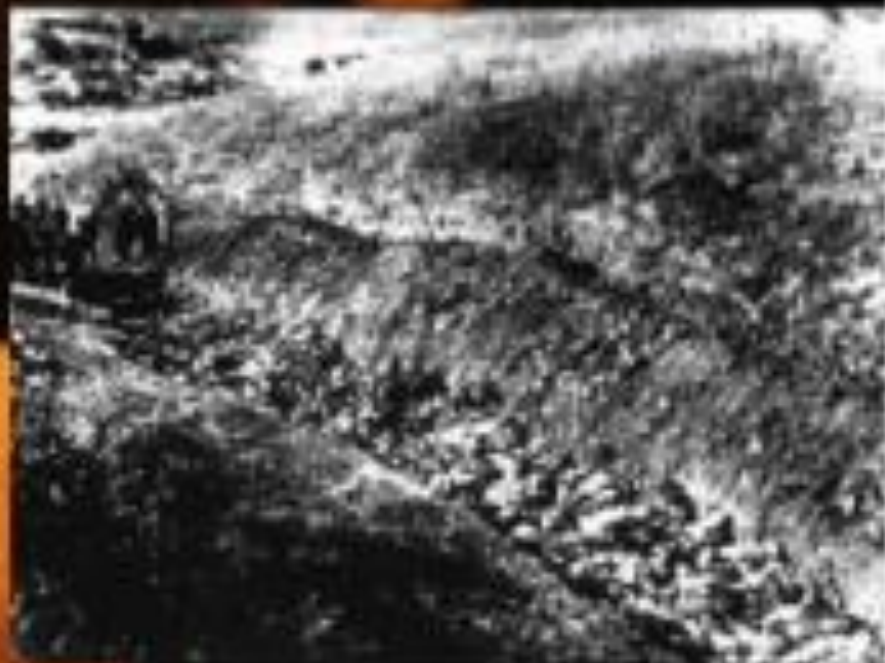
Бабий Яр, Киев, 1941 г.