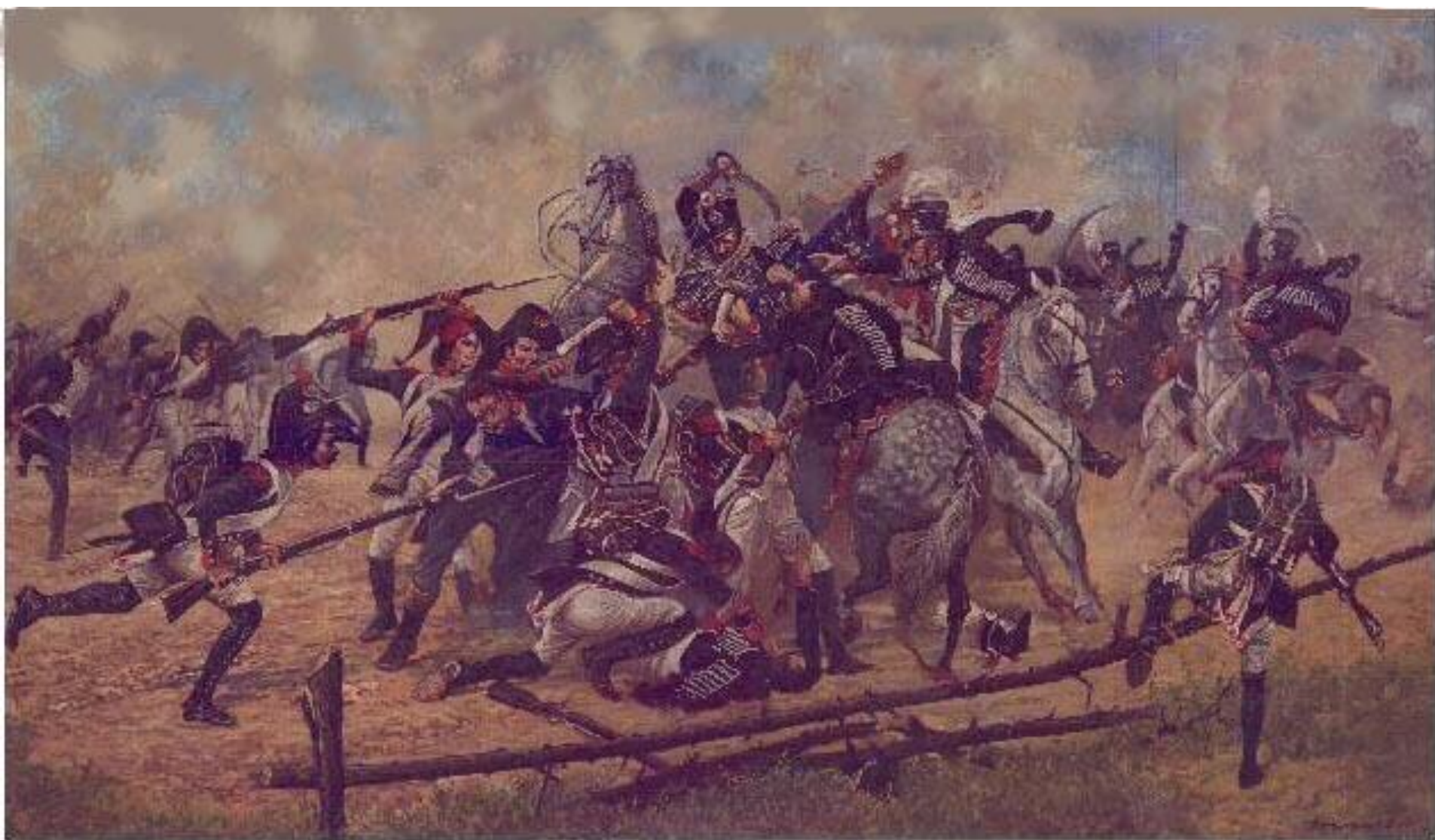
"Кто кого?" По ч.бел ксерокопии с карт. Коссака? Оригинал погиб в Германии 1944 г. Художник Виктор Болтышев "Who will win?" Kossac? ? Picture is drawn Victor Boltichev on monochrome xerocopy. The Original to perish in germanies in 1944.