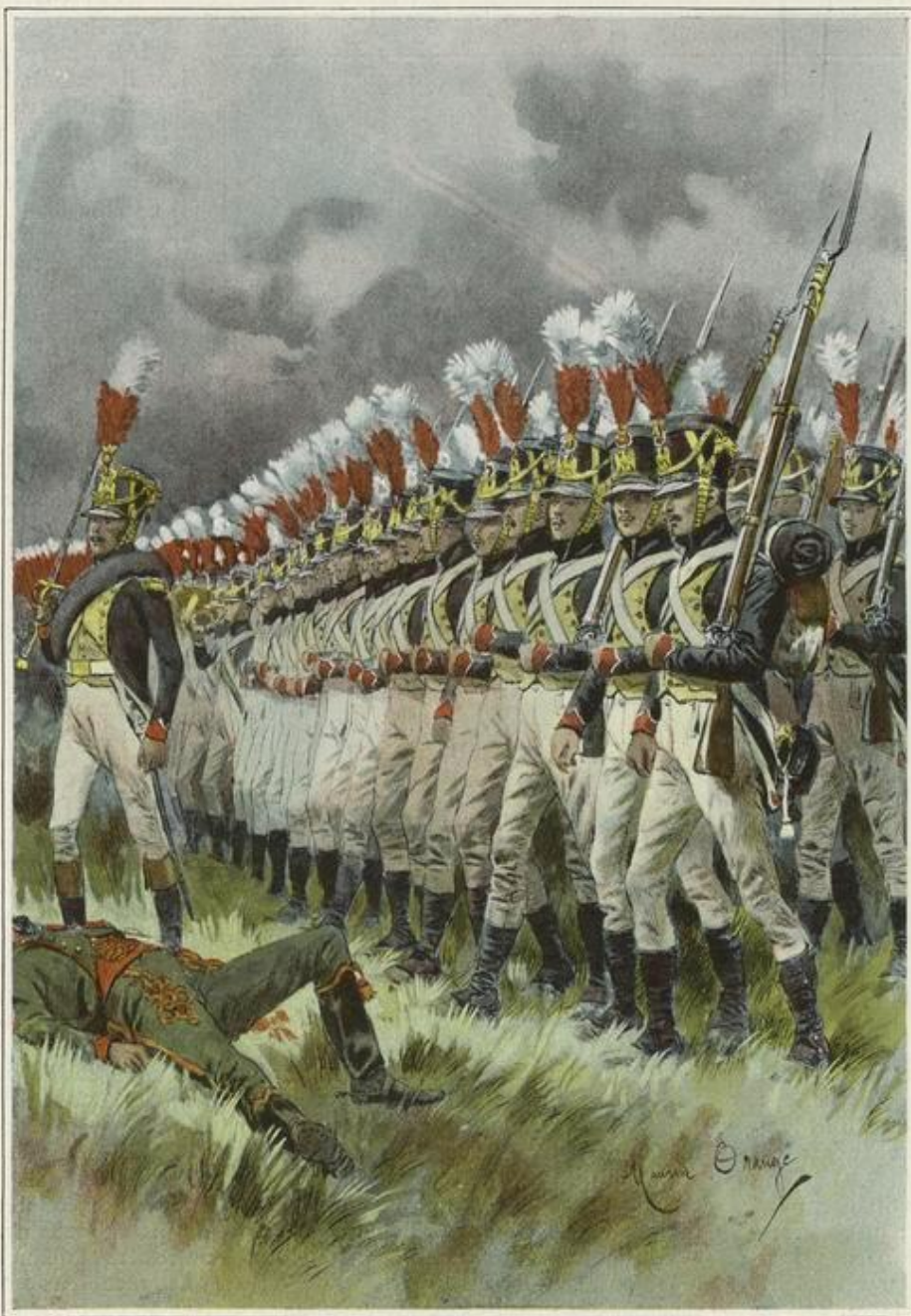
NOUS MARCHAMES L'ARME AU BRAS (page 4, numéro de janvier).