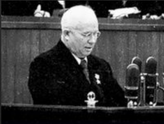
Н. С. Хрущёв