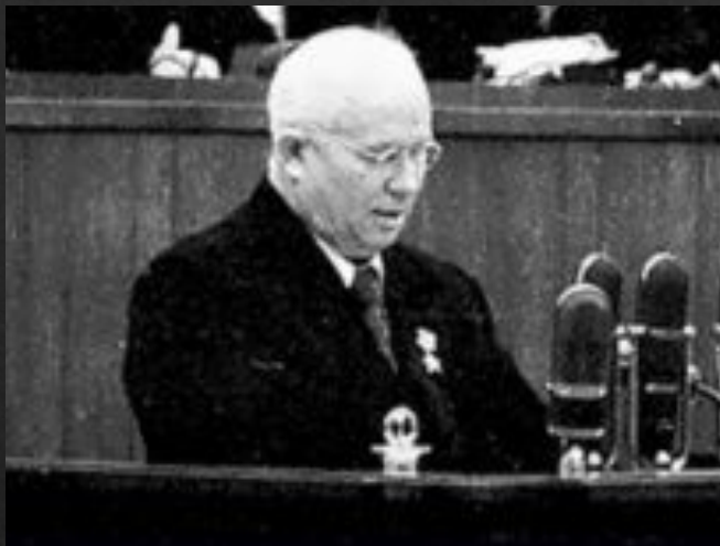
Н. С. Хрущёв