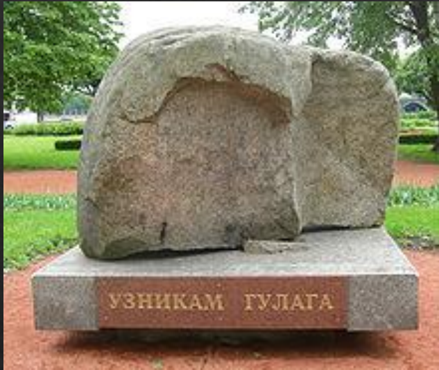
Соловецкий камень в Санкт-Петербурге — памятник жертвам политических репрессий