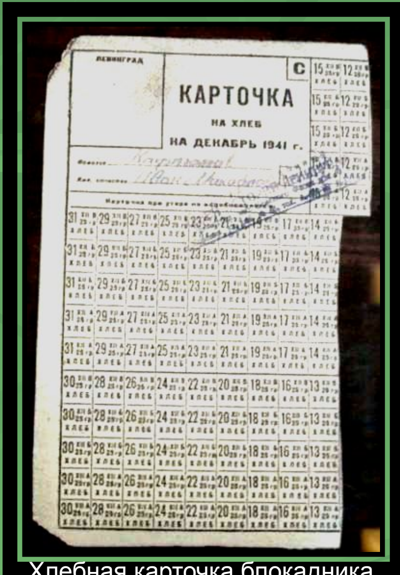
Хлебная карточка блокадника