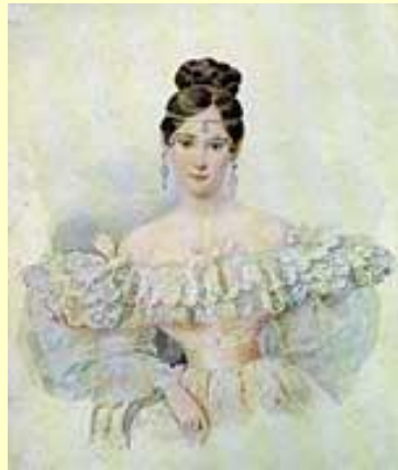
Натали Гончарова - жена А. С. Пушкина. и мать его 4 детей.