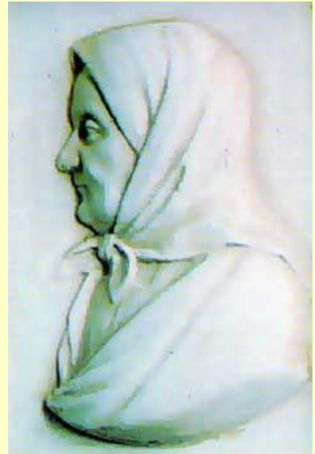
Няня Арина Родионовна