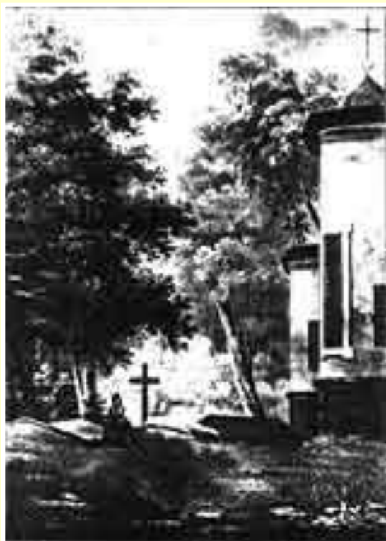
Могила А. С. Пушкина после смерти поэта