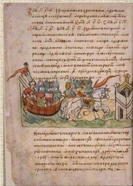
Нестор - первый русский летописец.