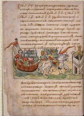
Нестор - первый русский летописец.