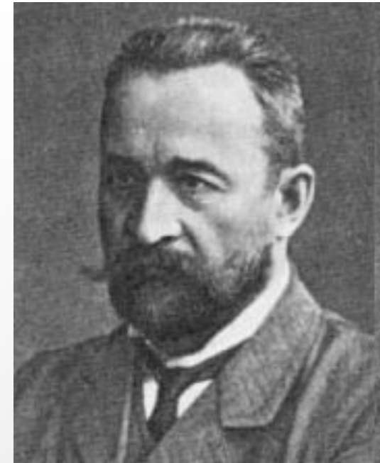
Князь Георгий Евгеньевич Львов