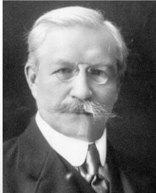
Павел Николаевич Милюков , председатель