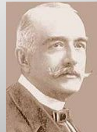
Сергей Андреевич Муромцев