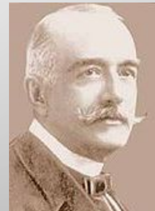
Сергей Андреевич Муромцев