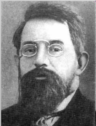
Пётр Бернгар- дович Струве