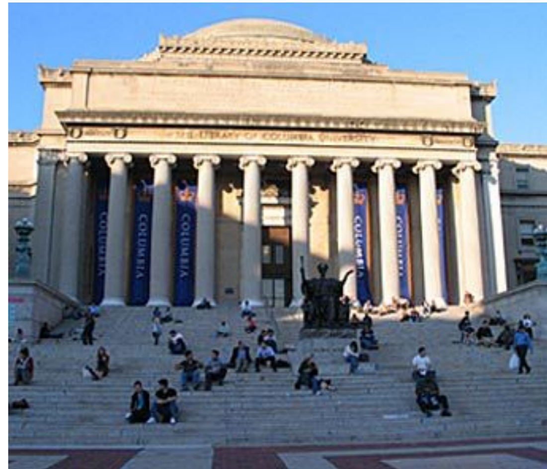
Главное административное здание (бывшая библиотека) Колумбийского университета

Окончил Йельский университет . Получил степень доктора в 1947 году в Колумбийском университете . Работал в различных государственных учреждениях, в том числе и в Казначействе . В 1958 году стал профессором, а в 1964 году — деканом экономического факультета Колумбийского университета. Консультировал государственные организации, был директором Национального бюро экономических исследований в 1973–1977 годах. С 1979 года был почётным профессором Колумбийского университета. Умер Викри в Харрисоне (штат Нью-Йорк ) 11 октября 1996 спустя несколько дней после объявления о присуждении ему Нобелевской премии по экономике .