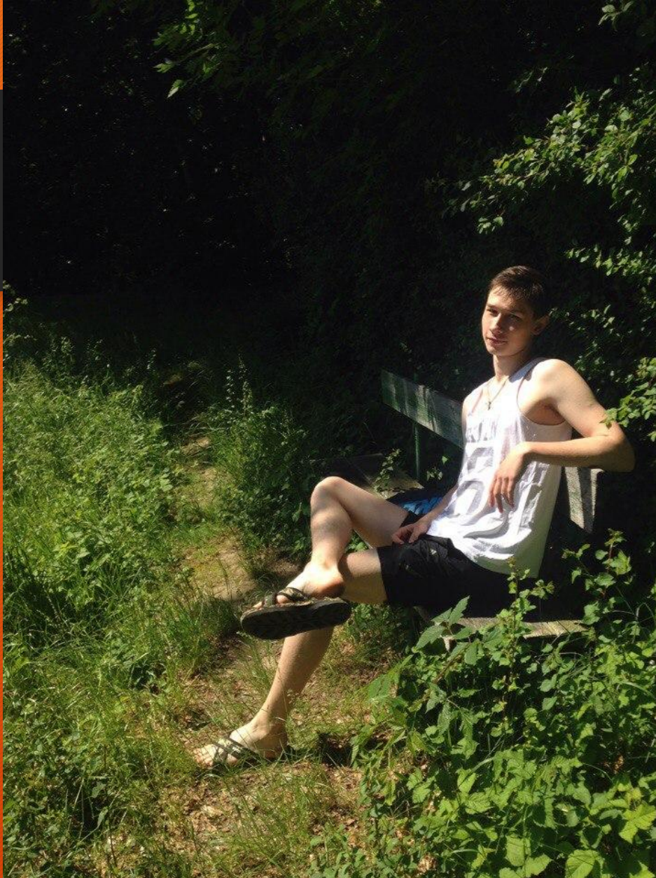
• Скамейка в лесу