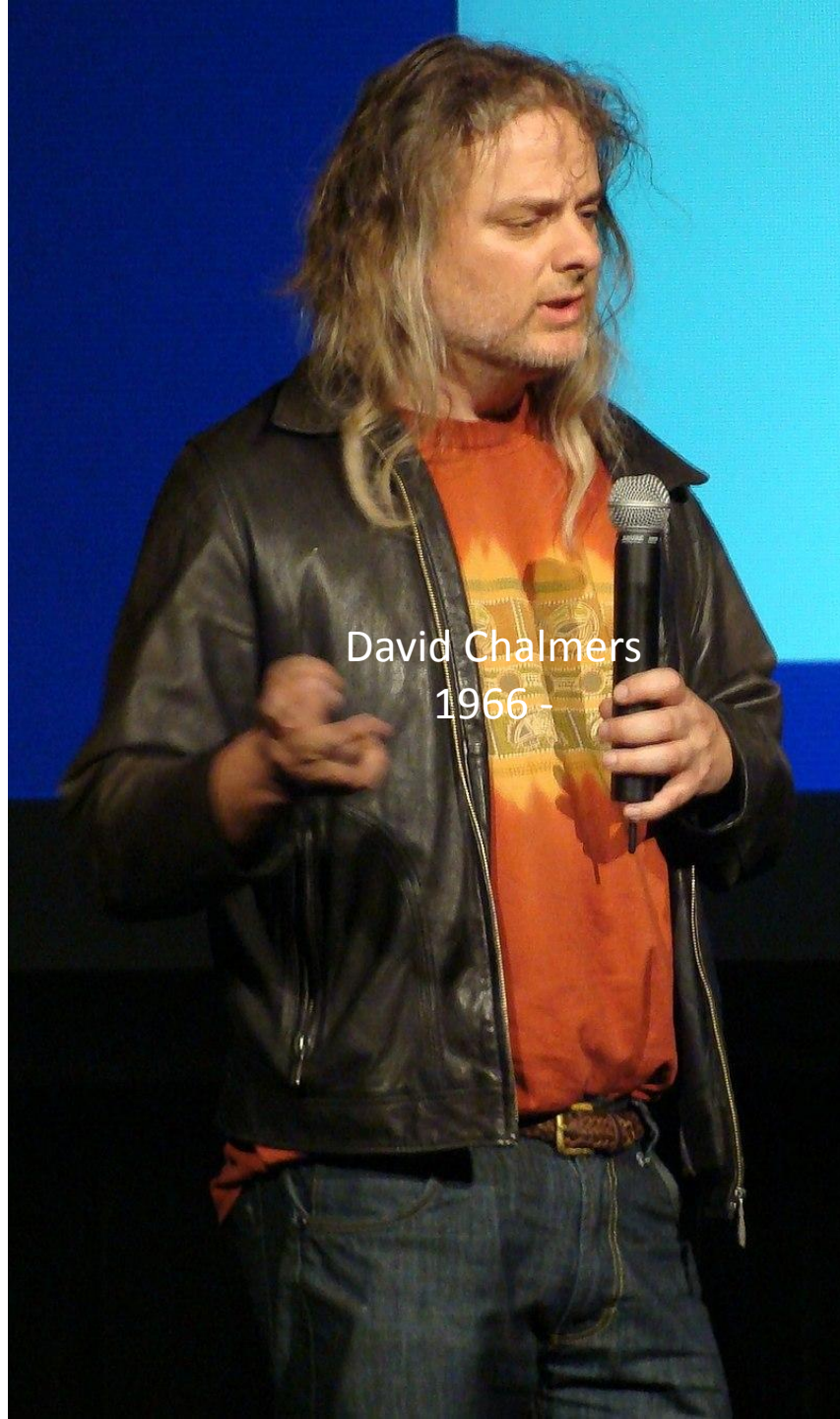
David Chalmers 1966 -