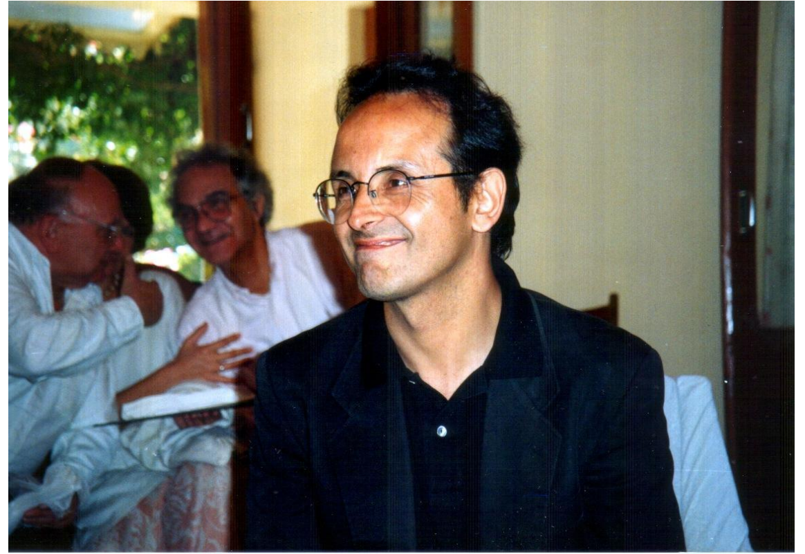
Francisco Varela 1946-2001