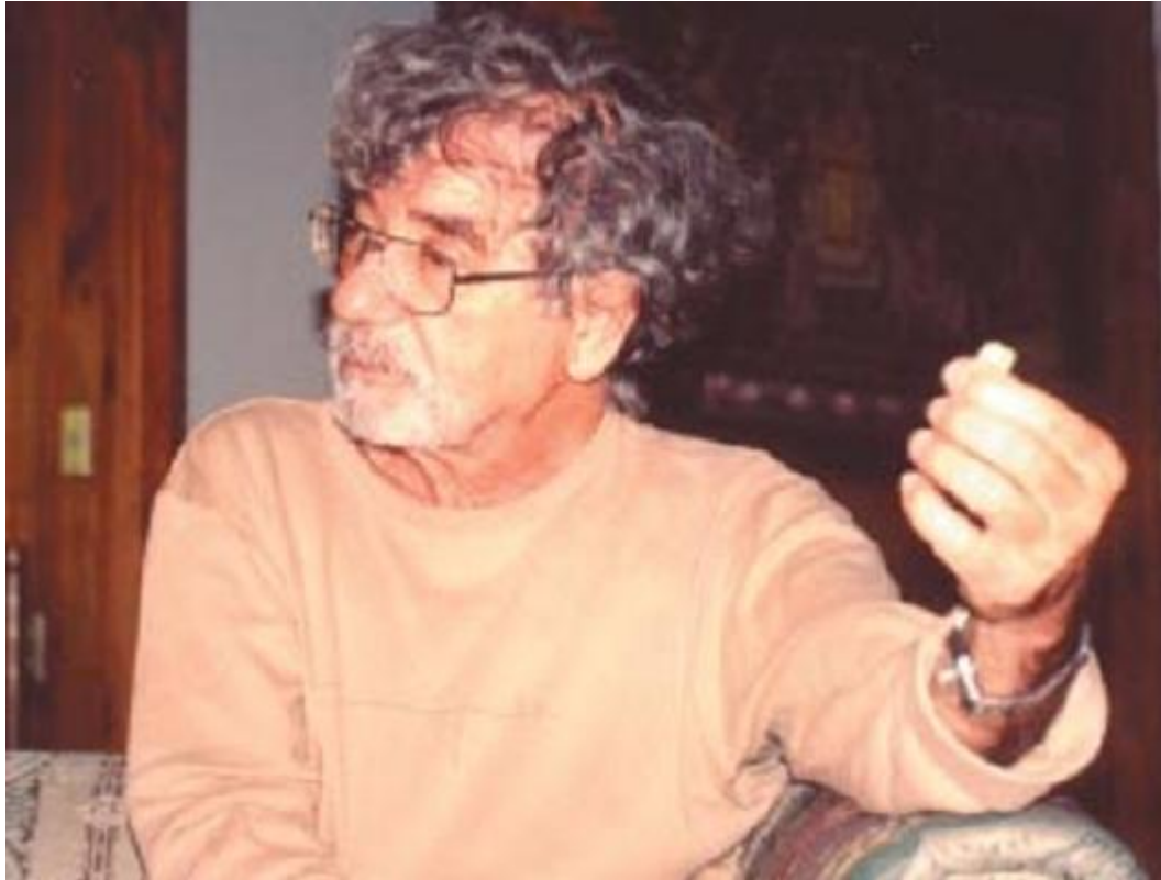
Humberto Maturana 1928 -