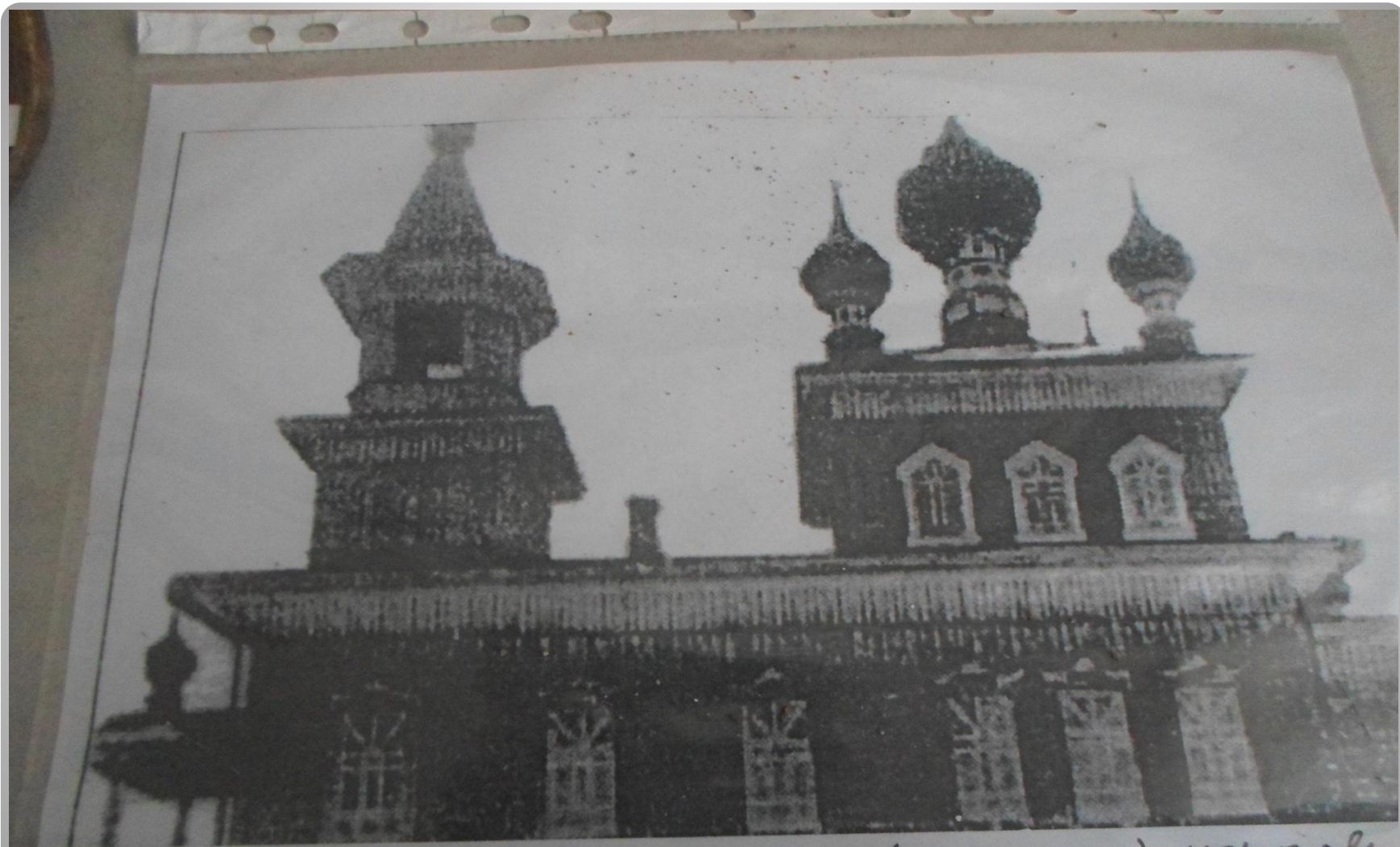
Богородицкая (старообрядческая) церковь