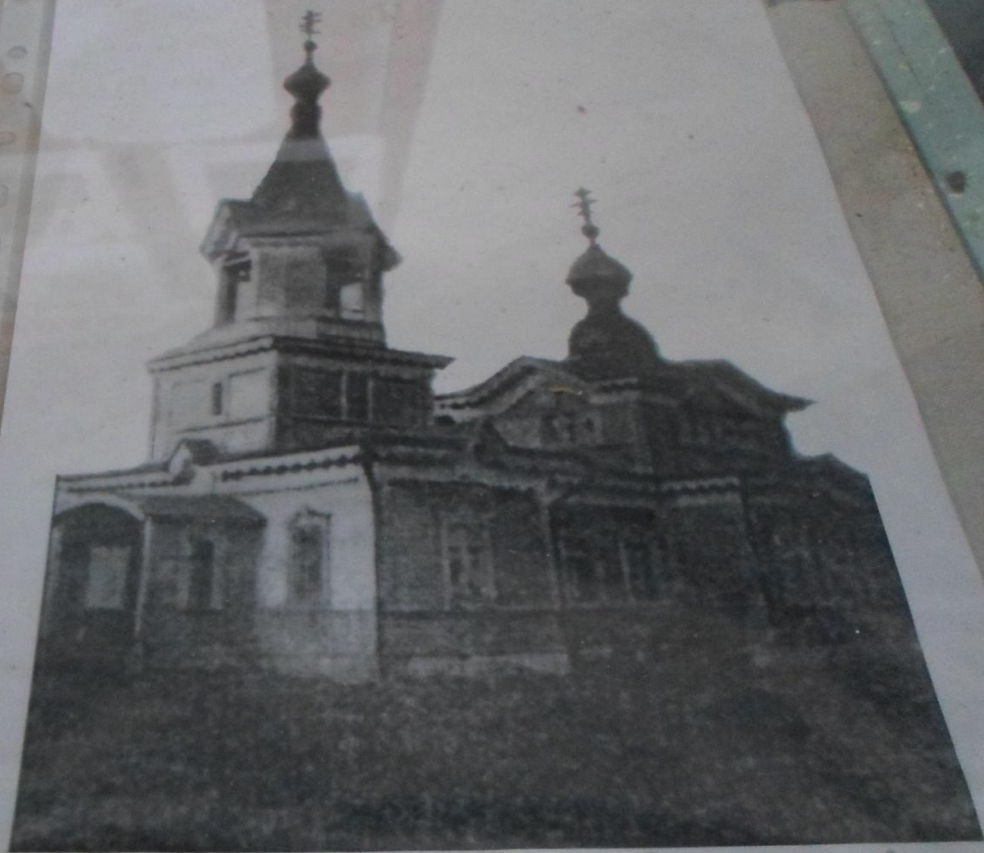
Музыкальная Дампфелская ЦЕРКОВЬ