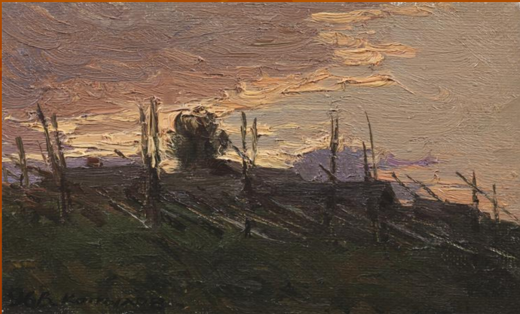
Вечер за околицей. 1996.