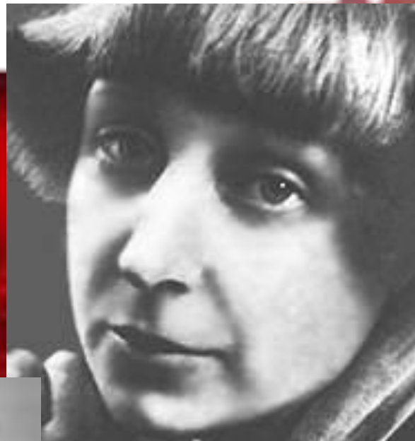
Марина Ивановна Цветаева