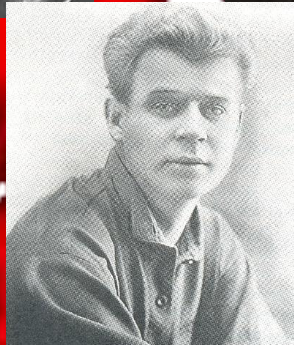
Сергей Александрович Есенин