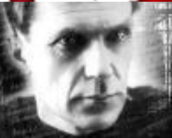
Варлам Тихонович Шаламов