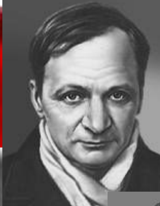
Андрей Платонов Платонов