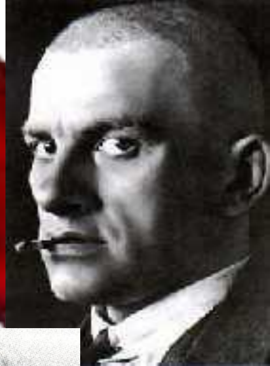
Владимир Владимирович Маяковский