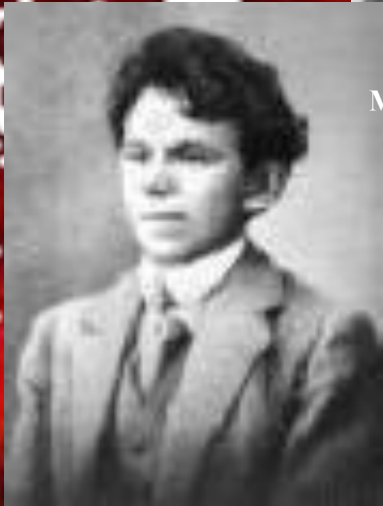
Осип Эмильевич Мандельштам