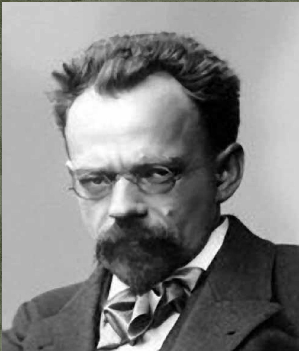
Иванов Сергей Васильевич (1864-1910)

Сергей Васильевич Иванов – русский художник, график, мастер социальных полотен на темы из крестьянской жизни, революционных сюжетов и русской истории. Родился в городе Руза Московской губернии в семье мелкого чиновника. Учился в Московском училище живописи, ваяния и зодчества у И. М. Прянишникова и Е. С. Сорокина, а затем в Петербургской академии художеств. Признание художнику принесла картина «В дороге. Смерть переселенца», где определилось пристрастие Иванова к жанру остросоциальной живописи.