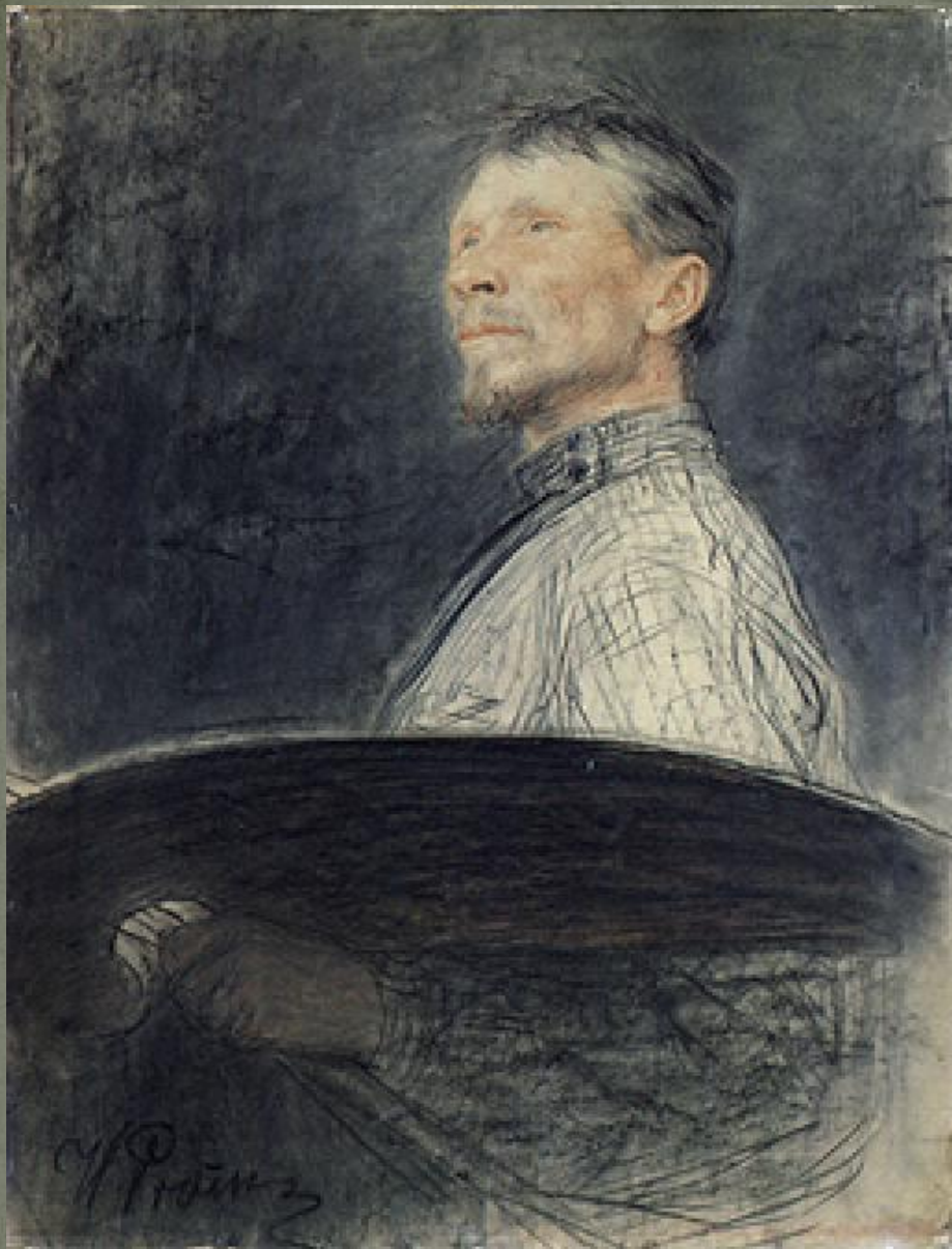
А. Е Архипов (1862 – 1930)

А.Е.Архипов родился на Рязанщине, в крестьянской семье, и не случайно жизнь русского крестьянства стала главной темой его творчества. С детства Архипов рисовал "везде, всегда, всюду, где только можно", как сам вспоминал впоследствии. Мальчик учился у приезжих иконописцев. Один из них, оказавшийся вольнослушателем МУЖВЗ, помог Архипову подготовиться и поступить в это училище.