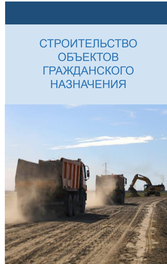
СТРОИТЕЛЬСТВО ОБЪЕКТОВ ГРАЖДАНСКОГО НАЗНАЧЕНИЯ