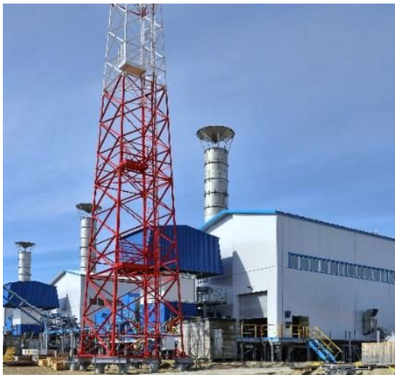
ОБУСТРОЙСТВО НЕФТЕГАЗОВЫХ МЕСТОРОЖДЕНИЙ