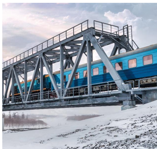
СТРОИТЕЛЬСТВО, РЕМОНТ И РЕКОНСТРУКЦИЯ АВТОМОБИЛЬНЫХ ДОРОГ, МОСТОВ, АЭРОДРОМОВ, БЛАГОУСТРОЙСТВО ТЕРРИТОРИЙ