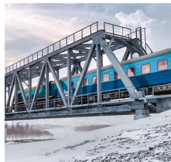
СТРОИТЕЛЬСТВО, РЕМОНТ И РЕКОНСТРУКЦИЯ АВТОМОБИЛЬНЫХ ДОРОГ, МОСТОВ, АЭРОДРОМОВ, БЛАГОУСТРОЙСТВО ТЕРРИТОРИЙ