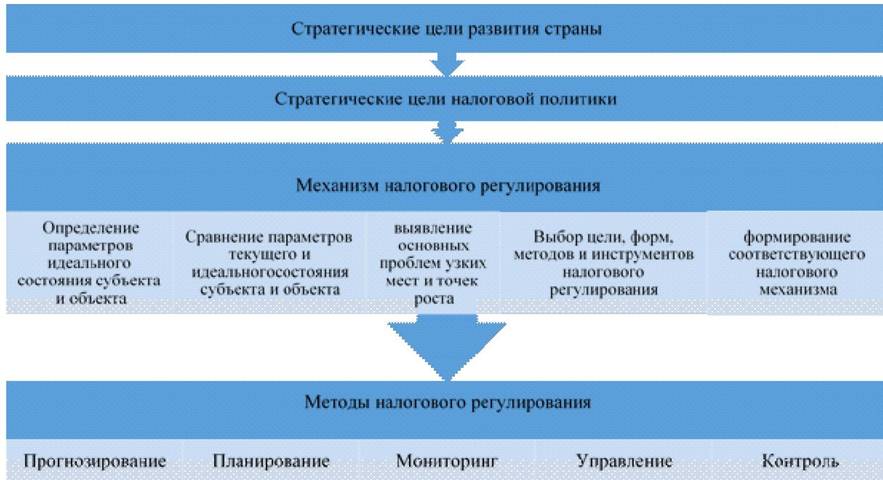
Рисунок 2. Механизм налогового регулирования как процесс