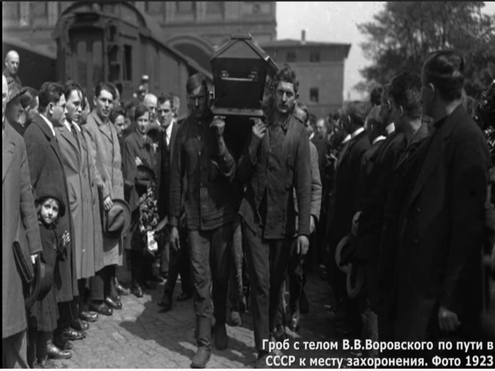
Гроб с телом В.В.Воровского по пути в СССР к месту захоронения. Фото 1923