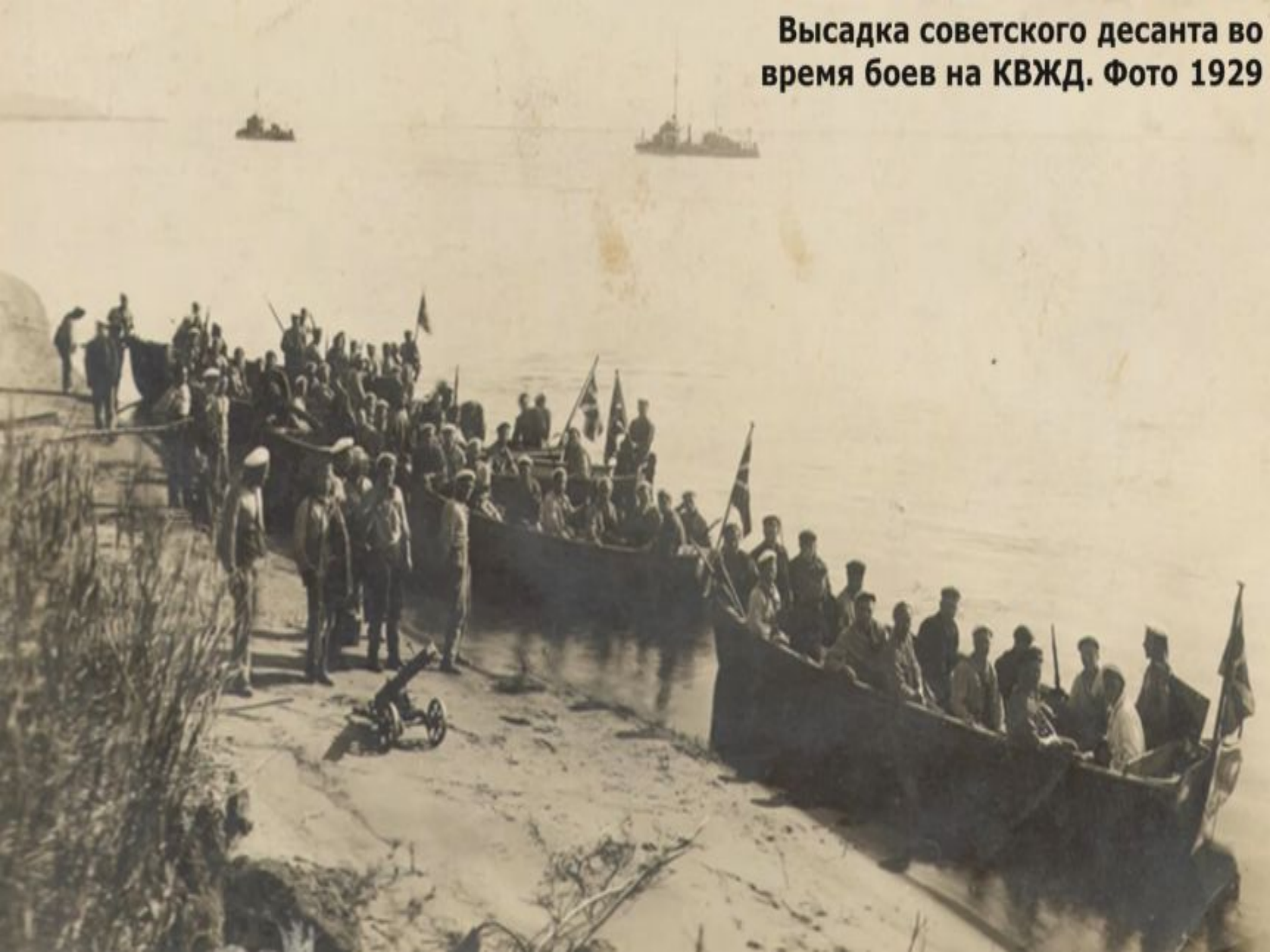
Высадка советского десанта во время боев на КВЖД. Фото 1929