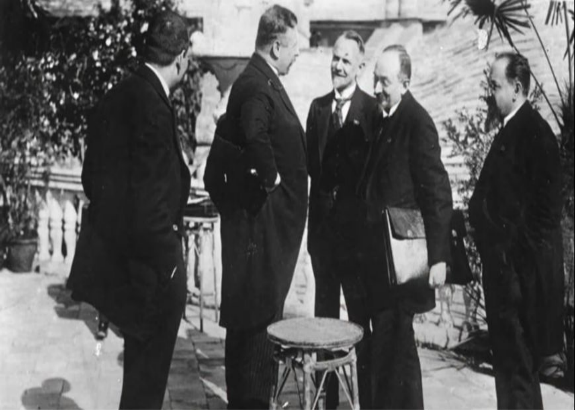
Советская и германская делегации в Рапалло. Фото 1922