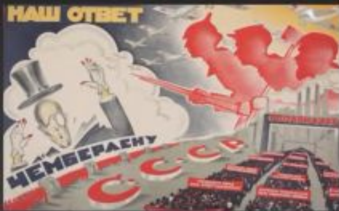
Советский плакат. 1927

1927 – убийство посла СССР в Польше П.Л.Войкова в Варшаве