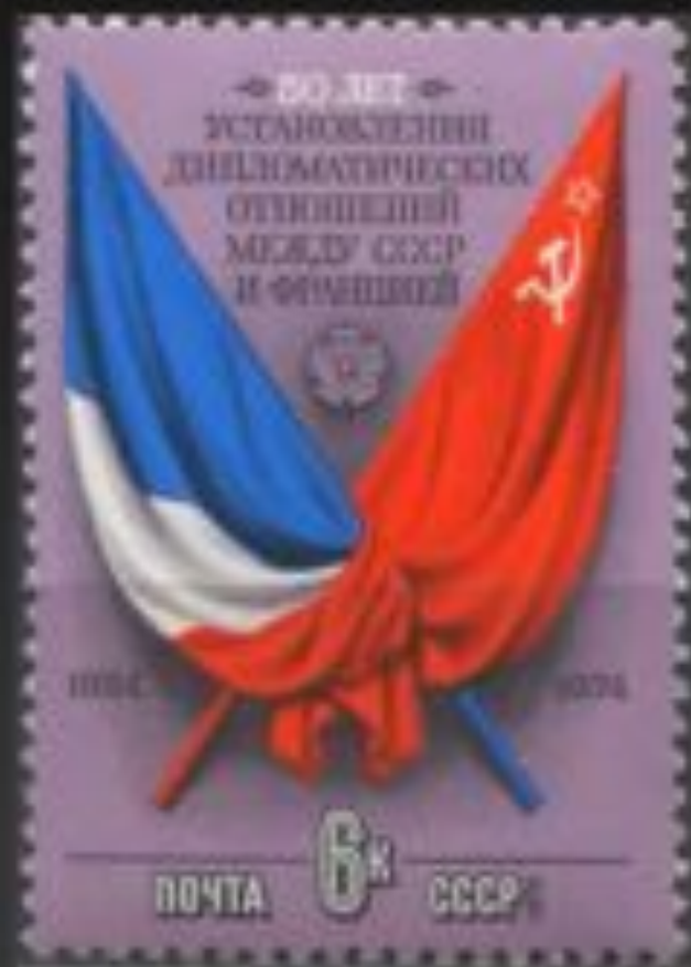
Почтовая марка в честь 50-летия установления советско-французских отношений. 1974.