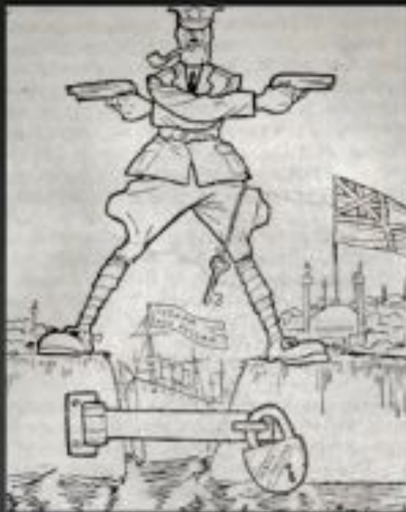
Советская карикатура. 1923