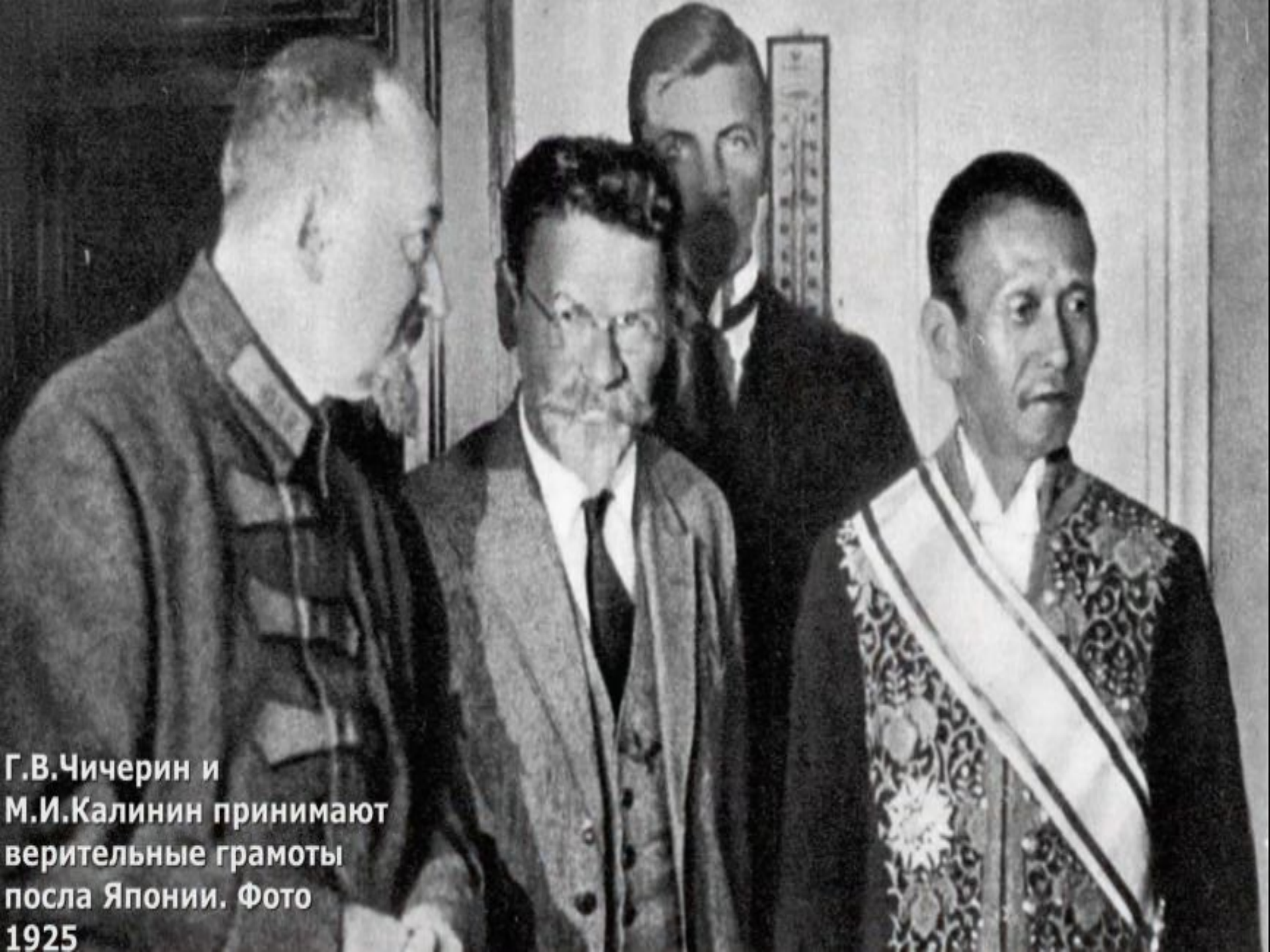
Г.В.Чичерин и М.И.Калинин принимают верительные грамоты посла Японии. Фото 1925