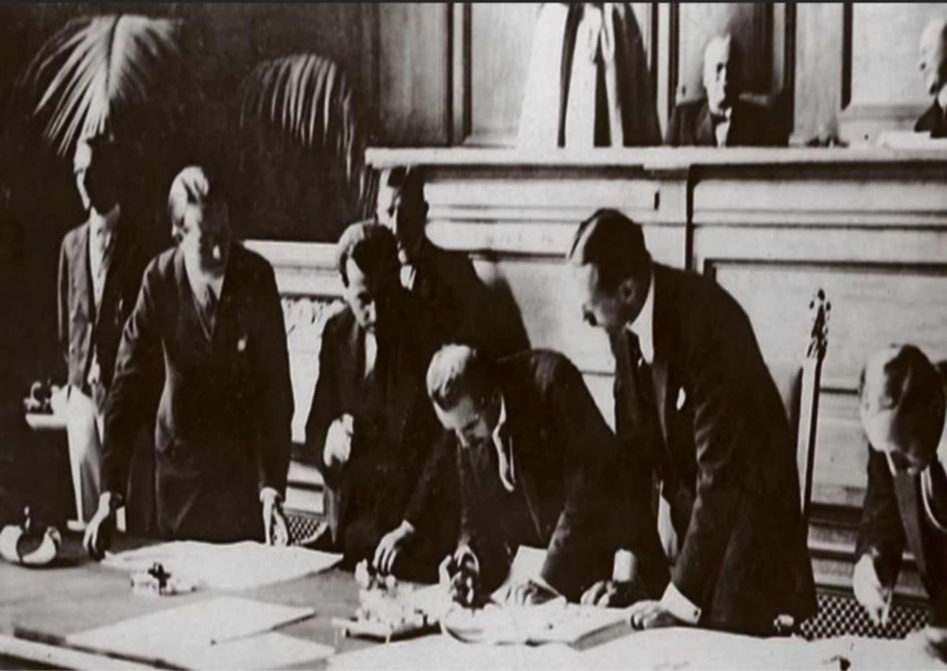
Подписание итоговых документов Лозаннской конференции. Фото 1923