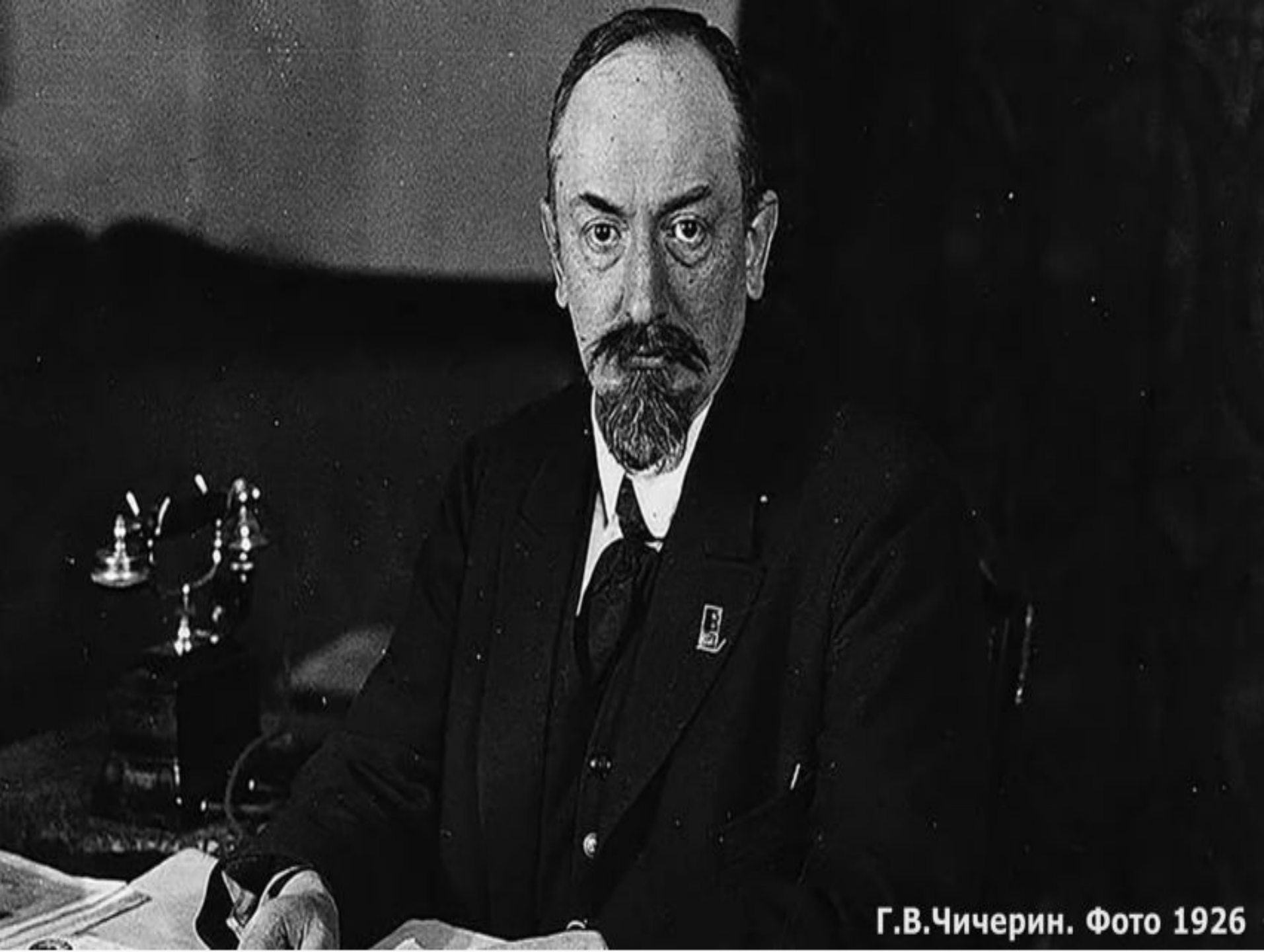
Г.В.Чичерин. Фото 1926