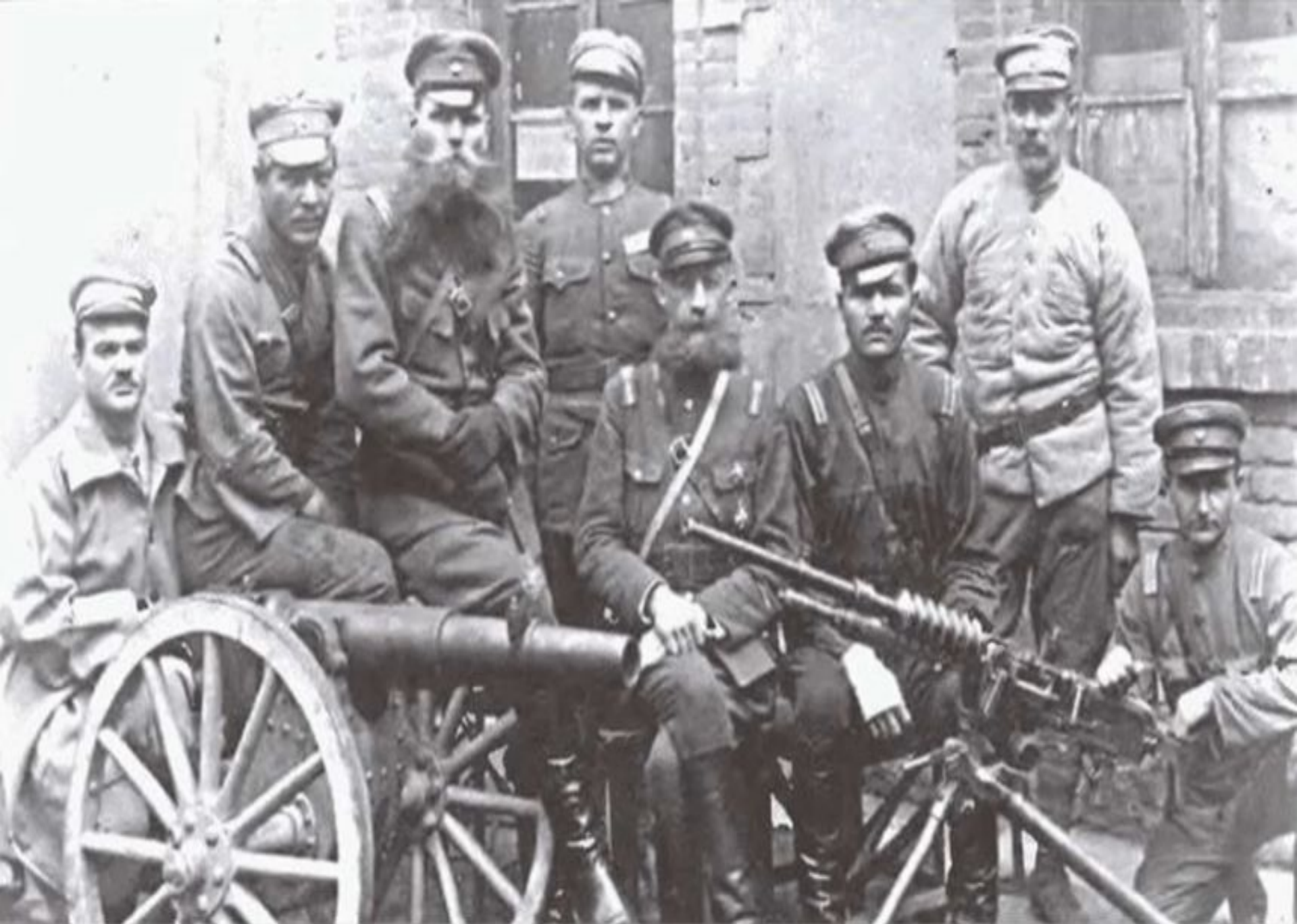
Русские белогвардейцы – наемники в китайской армии. Фото 1929