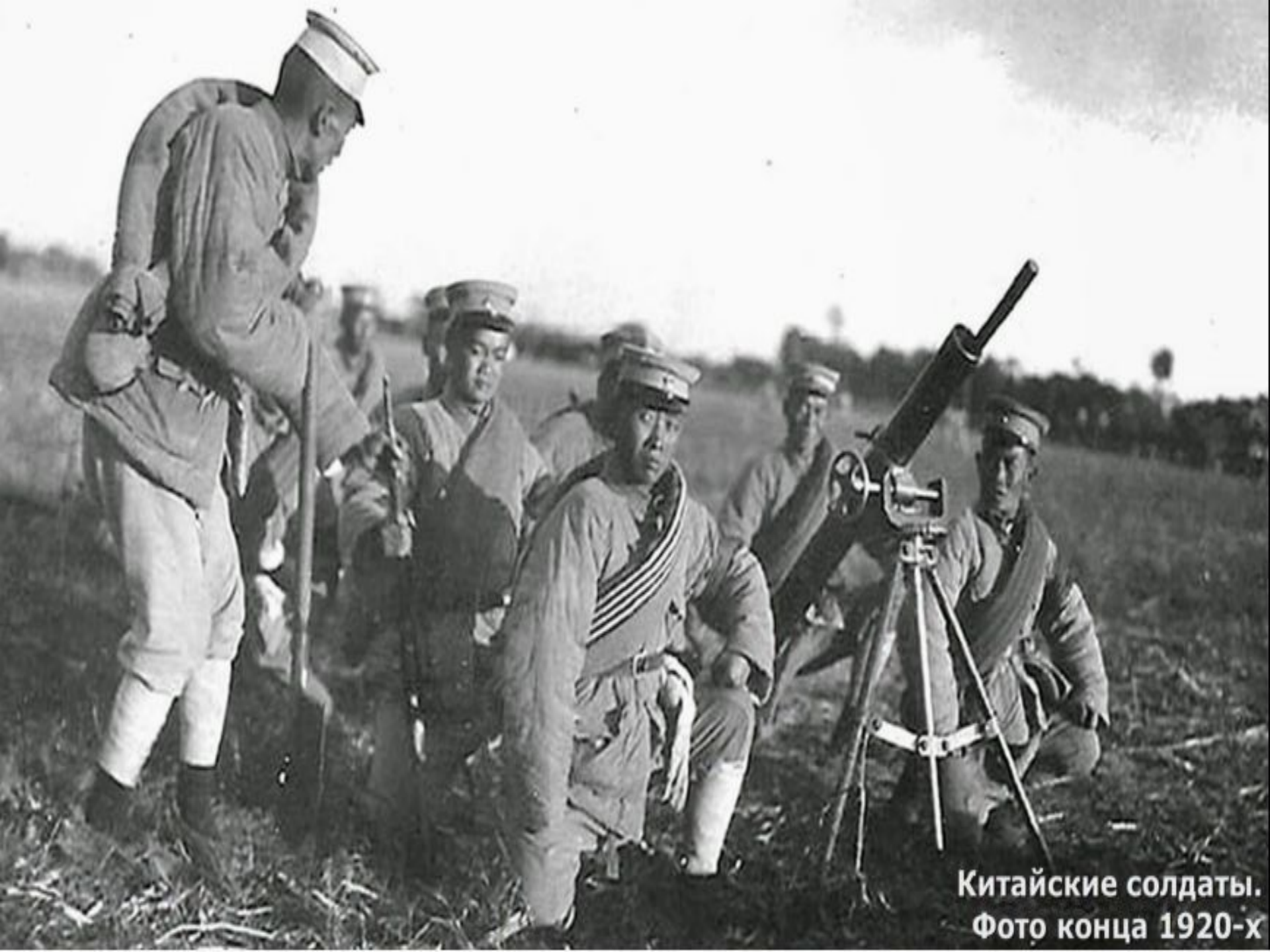
Китайские солдаты. Фото конца 1920-х