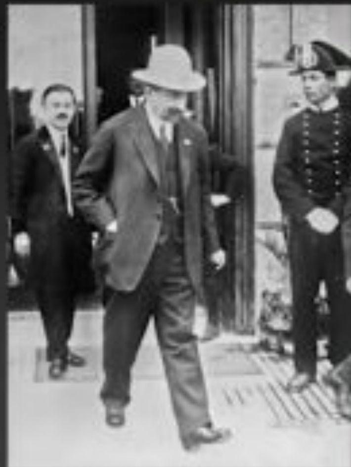
Г.В.Чичерин на Генуэзской конференции. 1922