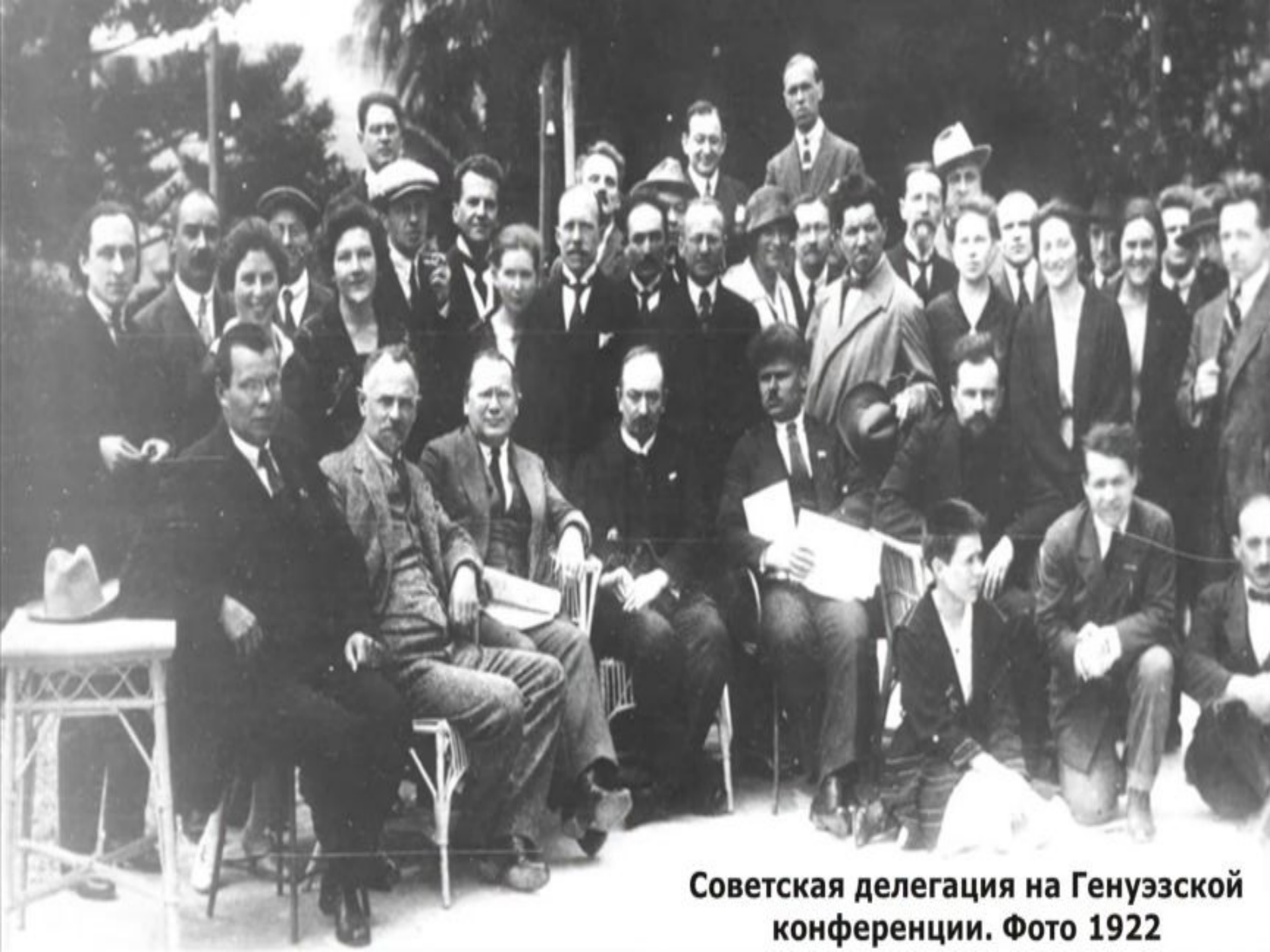
Советская делегация на Генуэзской конференции. Фото 1922