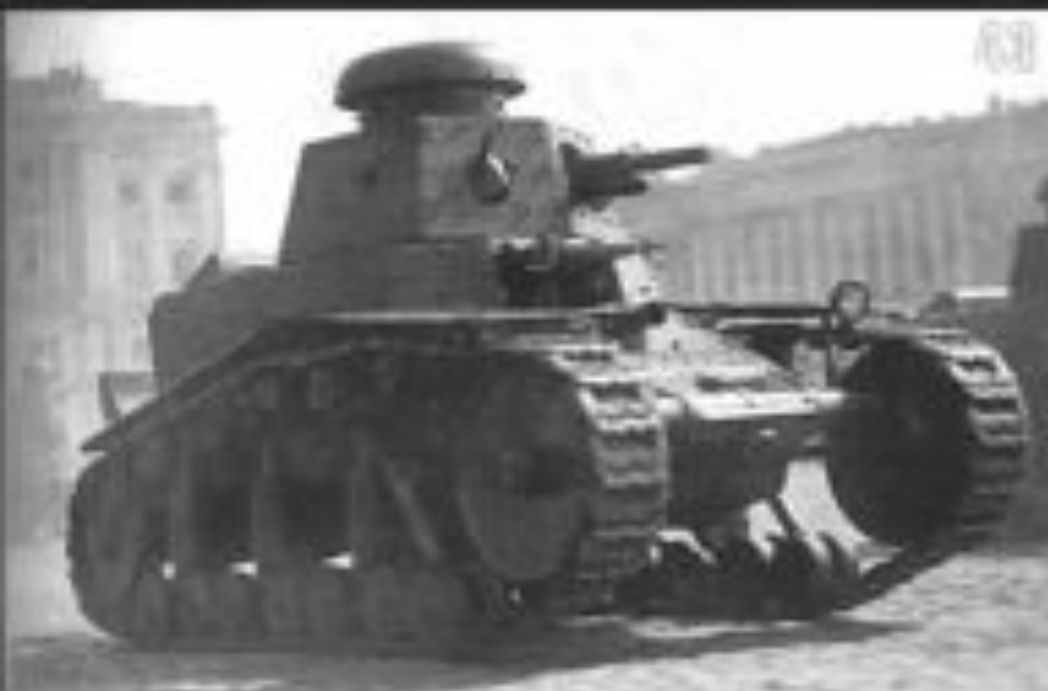
Советский танк МС-1 во время конфликта вокруг КВЖД. 1929

22 декабря 1929 – Хабаровский договор (восстановление контроля СССР над КВЖД)