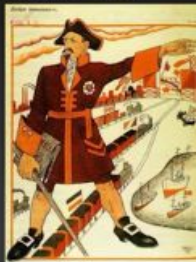
Г.В.Чичерин прорубает «окно в Европу». 1923

Участие в международных конференциях ( Генуэзская, 1922, Гаагская, 1922, Лозаннская, 1922 – 1923 )