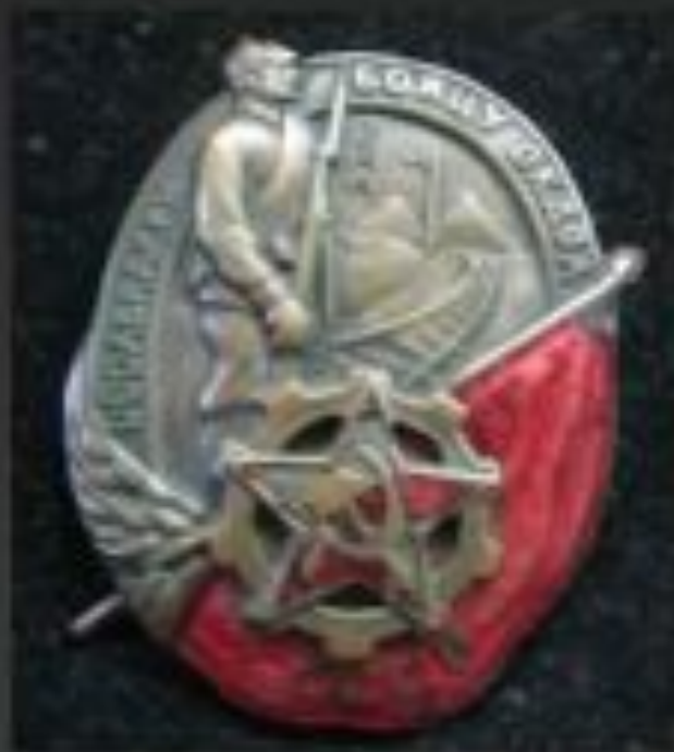
Почетный знак участника конфликта вокруг КВЖД