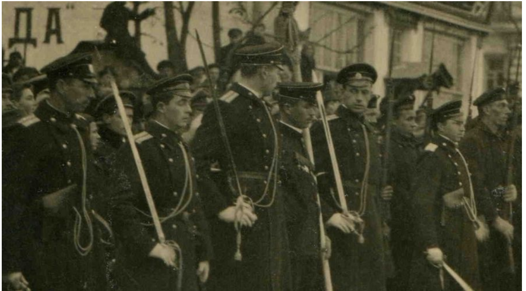
Морские стрелковые подразделения Белых армий на Восточном фронте в 1918 – 1920 гг.