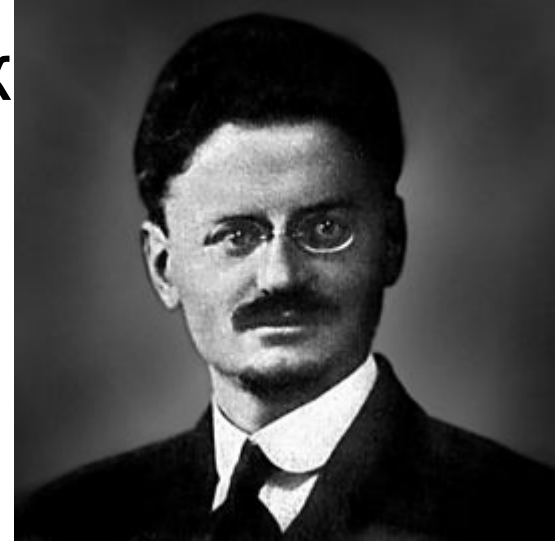
Троцкий Лев Давыдович