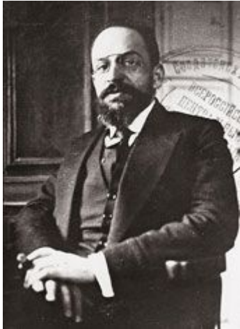
Иоффе Адольф Абрамович