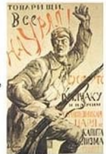
П. Киселич. Плакат «Товарищи, все на Урал!»