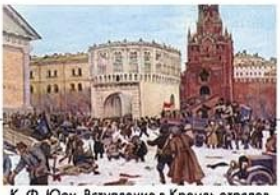
К. Ф. Юон. Вступление в Кремль отрядов Красной гвардии

1917 Октябрьская революция. Установление советской власти в России