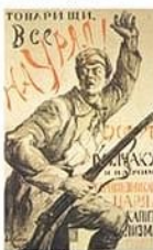
П. Киселис. Плакат «Товарищи, все на Урал!»