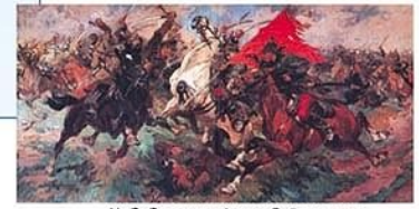
Н. С. Самокиш. Атака. Бой за знамя