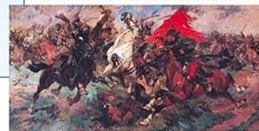
Н. С. Самокиш. Атака. Бой за знамя