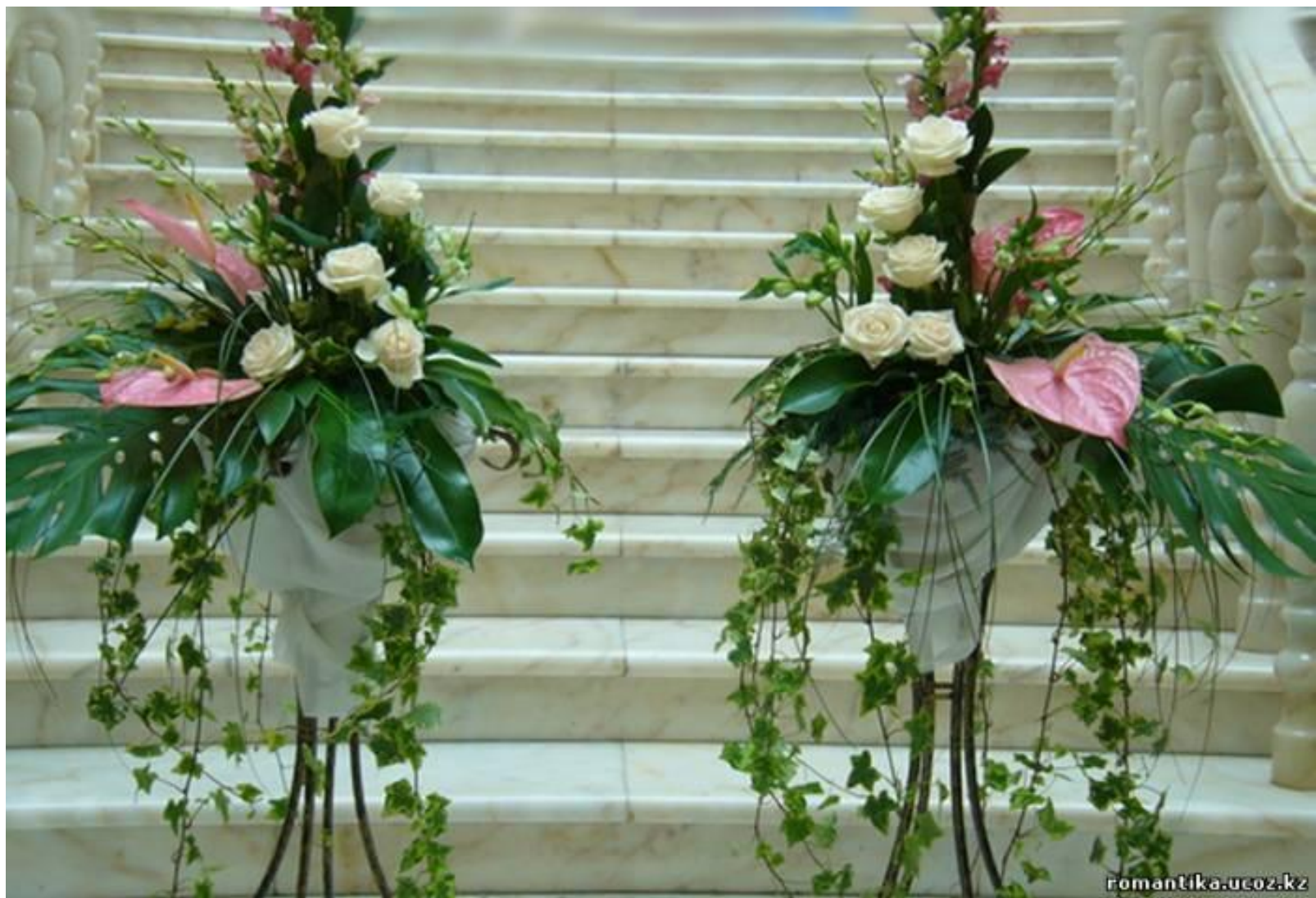
Цветочная композиция в интерьере