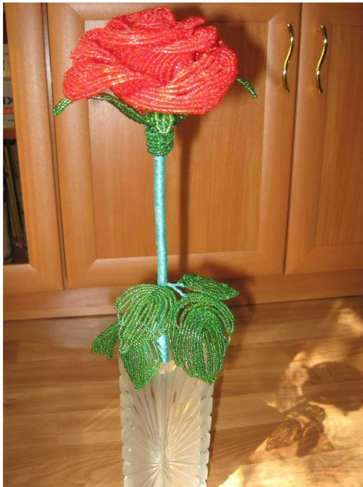
Цветы из бисера в интерьере