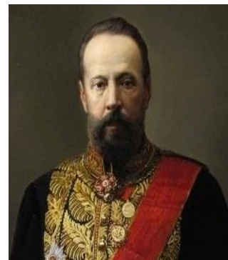
С. Ю. Витте