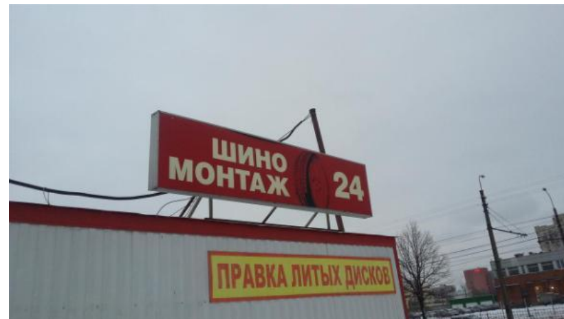
Фото искомого адреса или ближайшего соседнего – необходимо сделать фото адресной таблички. Если у здания нет таблички, то необходимо сделать фотографию ближайшей таблички с адресом к этому дому. Улица должна совпадать с искомой. Если нет ничего такого, то можете попросить у сотрудника автосервиса визитную карточку, на которой указан адрес организации.

Фото фасада - Вывески организации, Общий план здания, въезд в подземную парковку; фотография Вывески, если она есть.