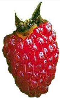
Многокостянка (сложный плод)