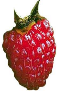
Многокостянка (сложный плод)