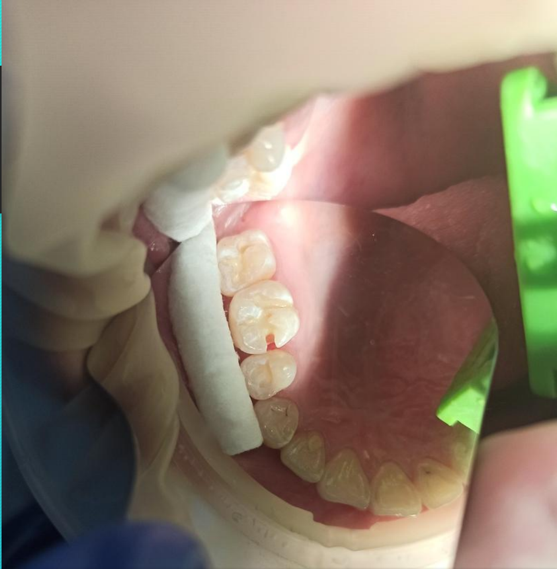
17, 16 тістеріне «Віосал» сәулемен қатаятын емдік төсемі қойылды.