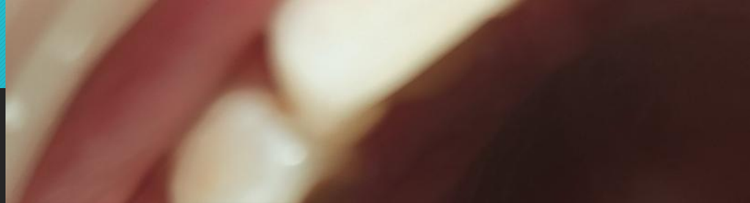
17, 16, 15 тістерін 37% ортофосфор қышқылымен өңдедім