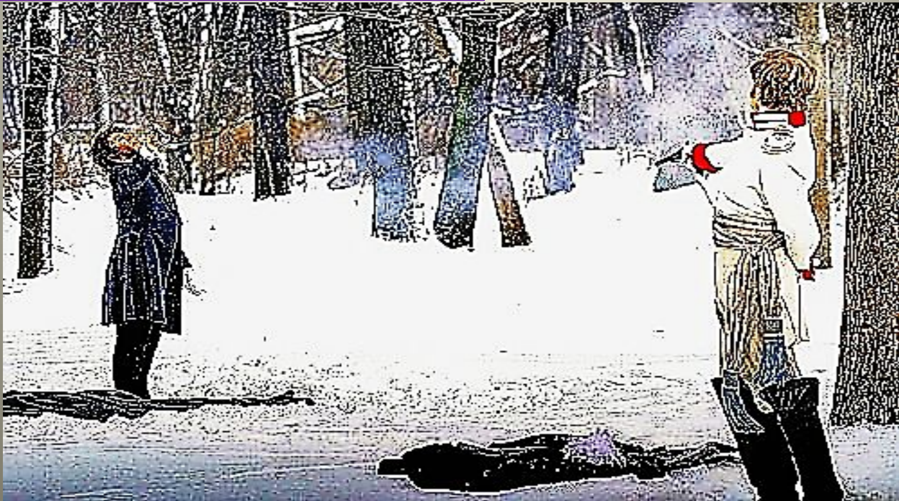
Дуэль Пушкина с Дантесом