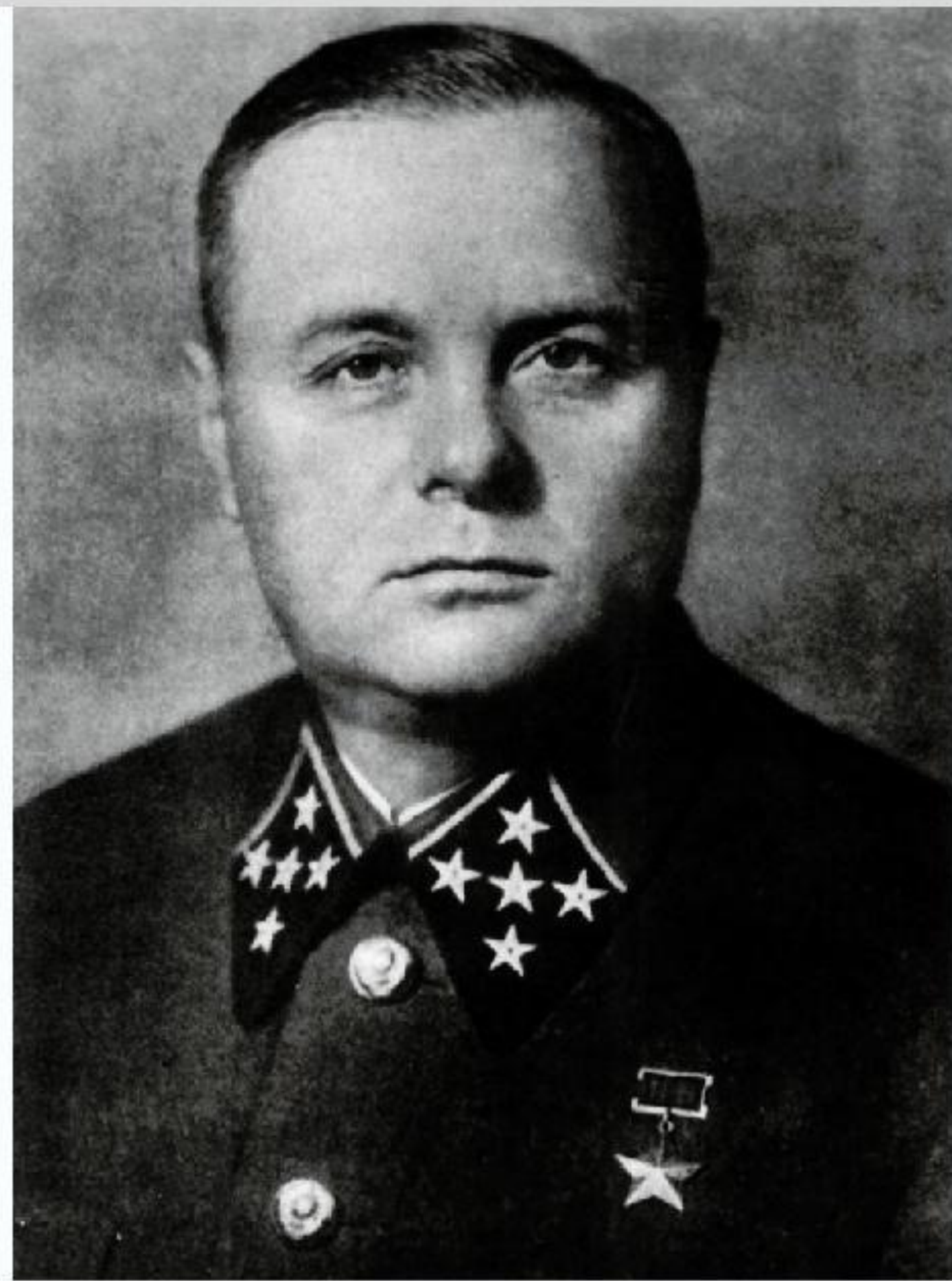
Генерал армии К. А. Мерецков