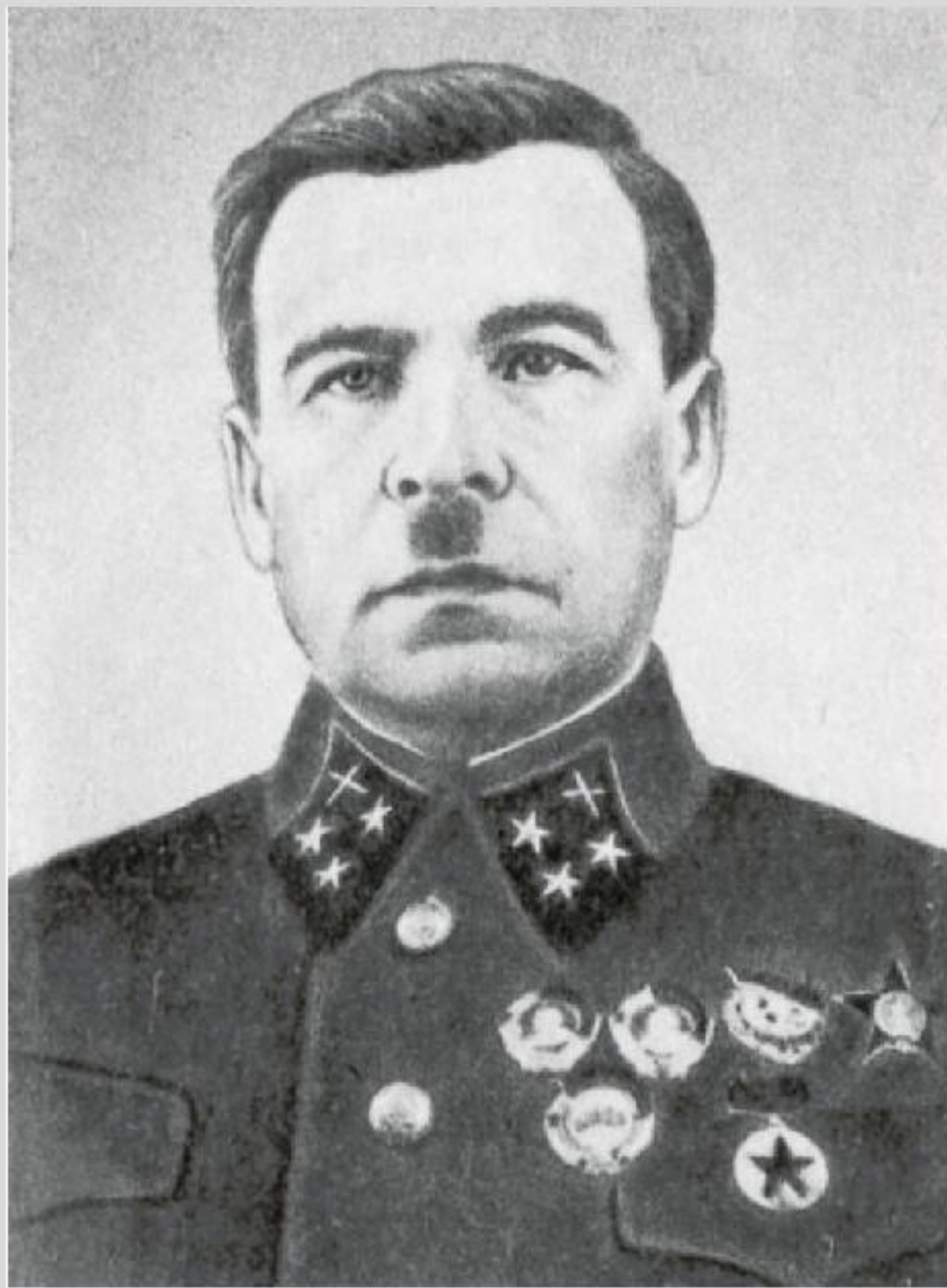
Генерал-лейтенант Л. А. Говоров