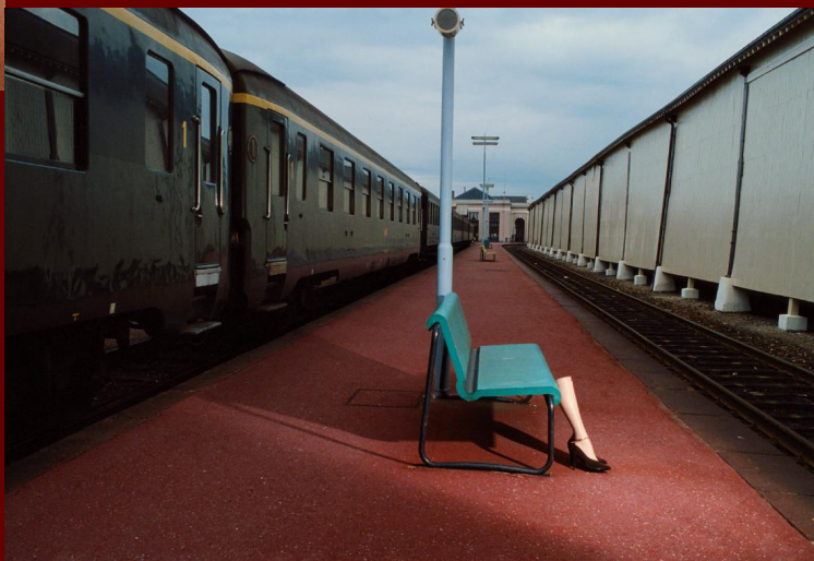
Серия «Гуляющие ноги»