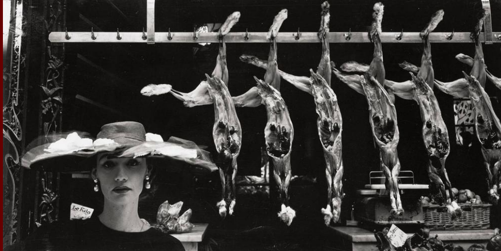
Первый заказ от французского Vogue: рекламная съемка женских шляп.