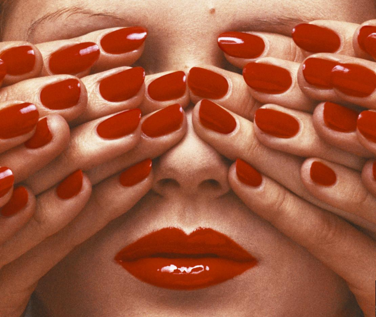
Самый знаменитый кадр Бурдена