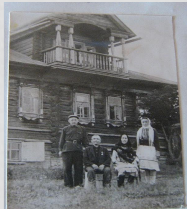
Здание правления колхоза «Онар»

Организовали помощь пожилым людям, участникам войны, больным. Работы в колхозе «Онар» было много. Мальчики 5 – 6 классов вывозили на поля навоз, ребята 7 класса боронили колхозные поля, участвовали в тереблении льна, осенью копали картофель. С утра 3 часа учились, после обеда 3 часа трудились в поле.