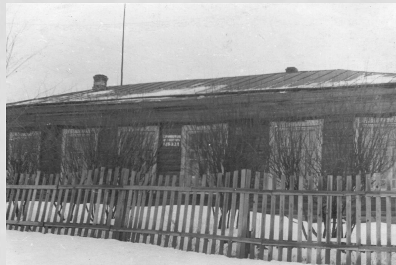
Здание Старокрещенской семилетней школы.