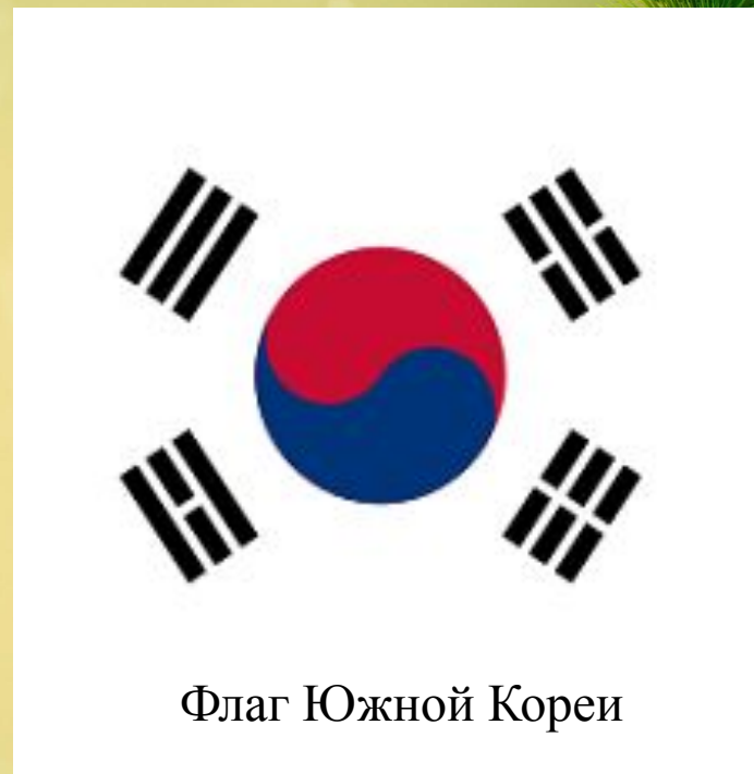
Флаг Южной Кореи