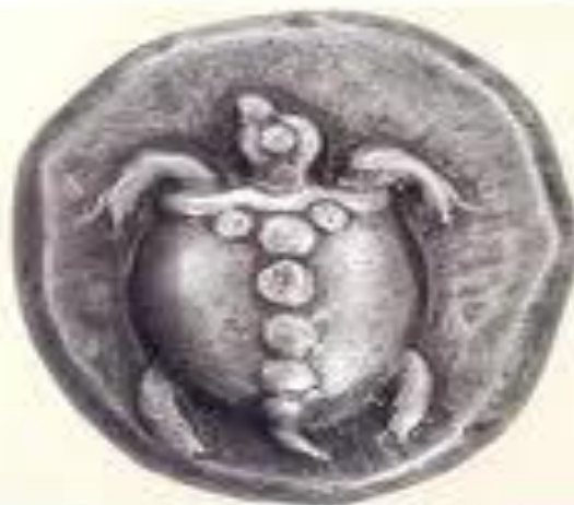
Статер Згнна, 480-е гг. до н.э. Серебро, диаметр 24 мм, вес 19 гр.