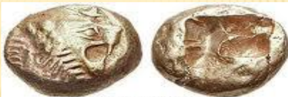
Лидийская монета, 610-600 гг. до н.э. Злектр, макс. размер 13 мм, вес 4,70 гр.