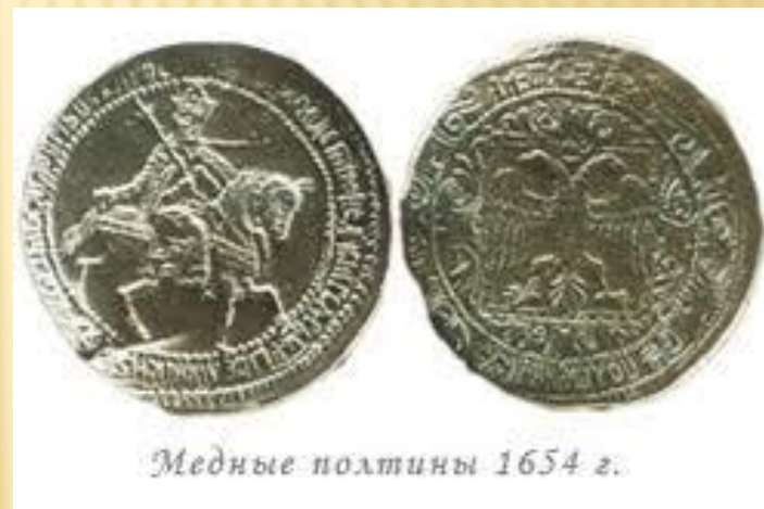
Медные полтины 1654 г.