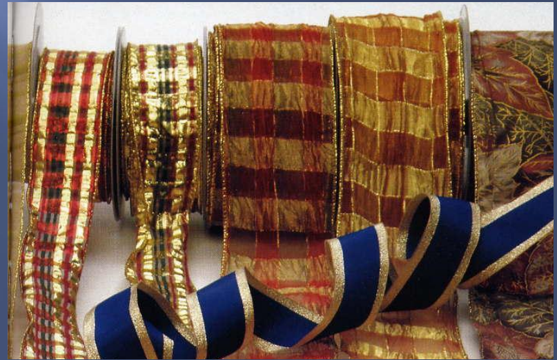
Отделочные ленты и тесьма