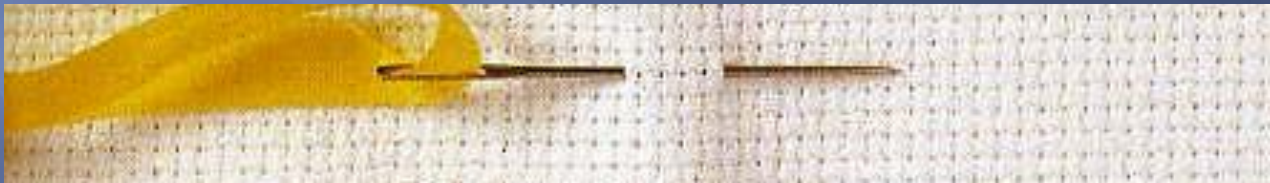
Игла для шёлковых ленточек