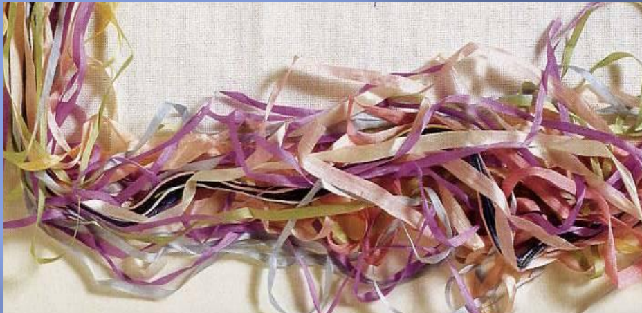
Шёлковые и атласные ленты от 3 мм до 20 мм