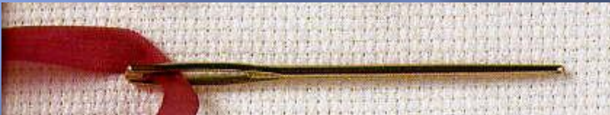
Игла для тесьмы и ленточек