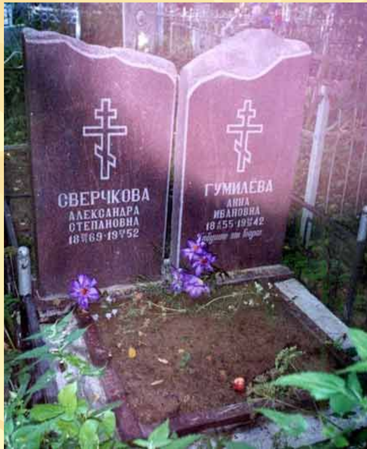
Могила матери Н.Гумилева в Бежецке