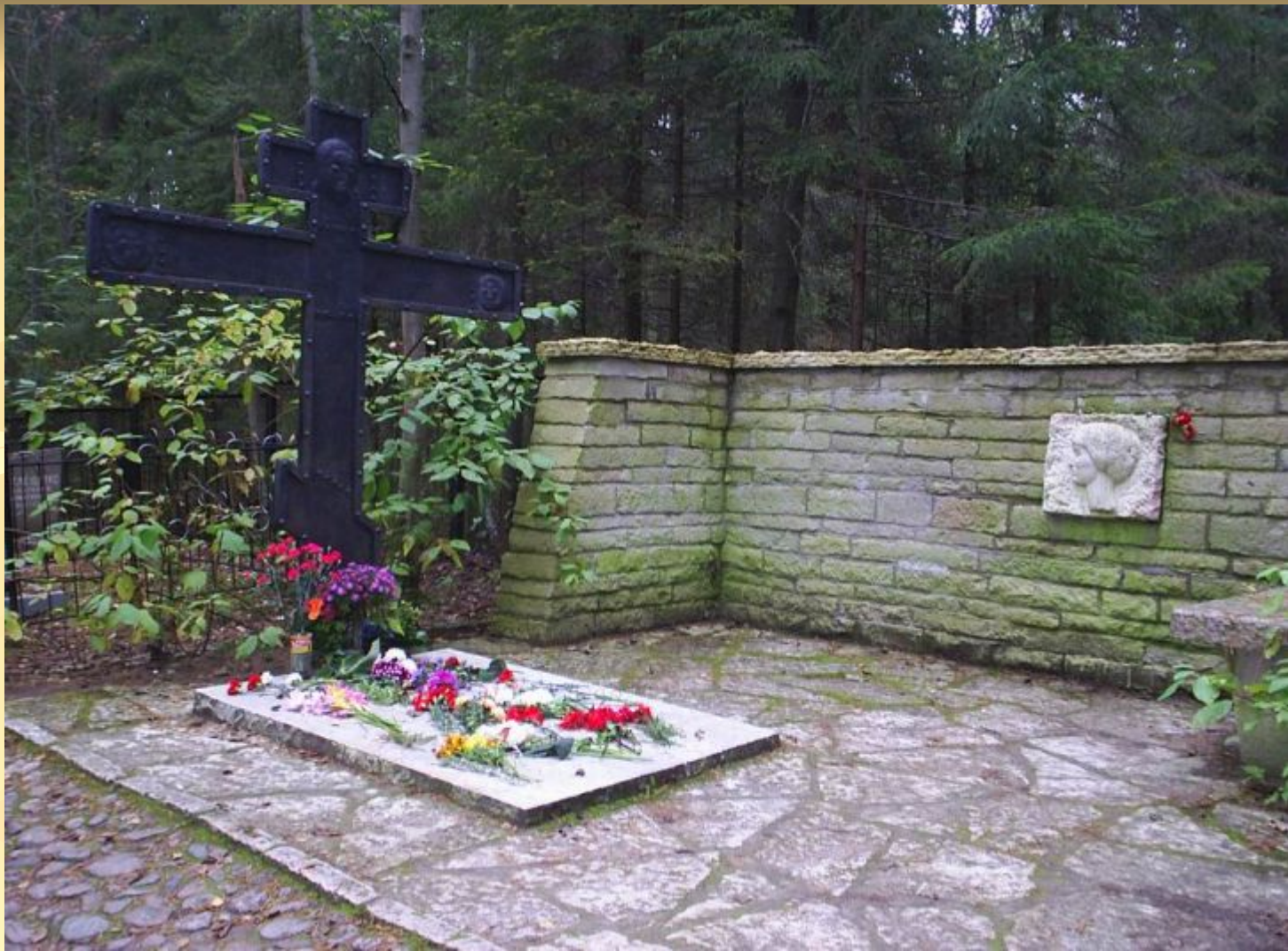
Могила Анны Андреевны Ахматовой в Комарово (близ Санкт-Петербурга)