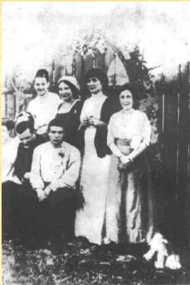
А.А.Ахматова в имении Гумилевых Слепневе 1912 г.

После революции 1917 г. семья Гумилёвых покинула этот дом и переехала в Бежецк. Опустевший слепнёвский дом использовали для разных хозяйственных нужд, а деревня Слепнёво постепенно исчезала.