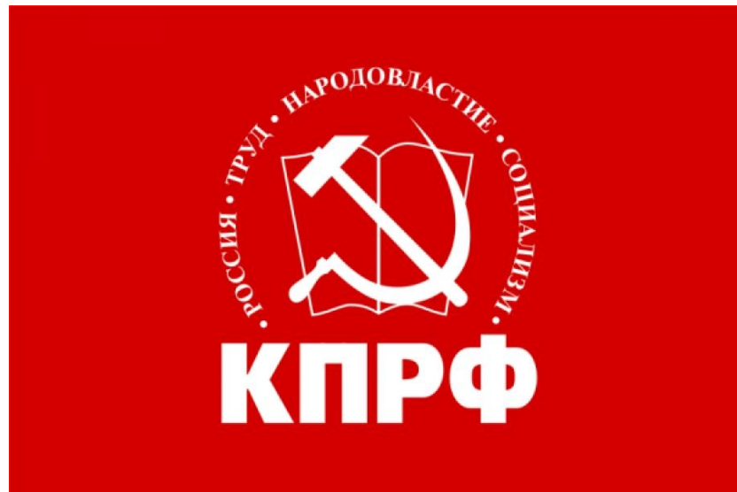
Официальный цвет и логотип партии