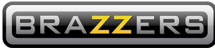
Логотип сайта для взрослых

Этим мы подчеркнули, что партия идёт в ногу со временем и у неё есть чувство юмора.