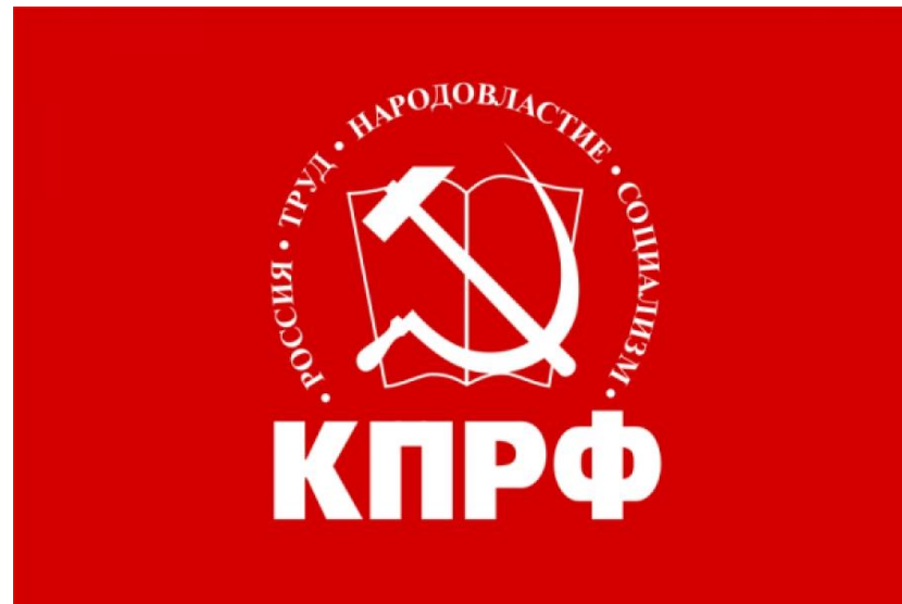
Официальный цвет и логотип партии