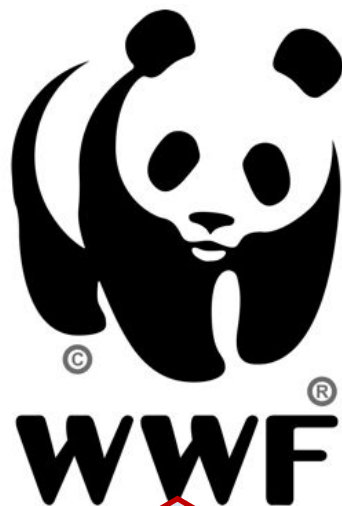
Природоохранная организация «Всемирный