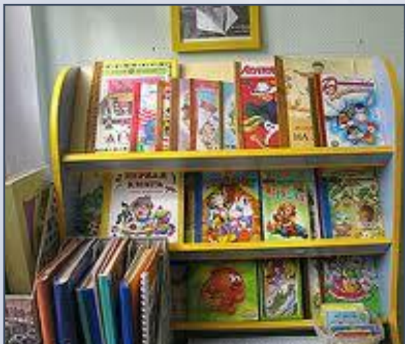
Расположение уголка в групповой комнате