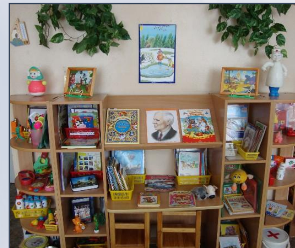
Удобство и целесообразность