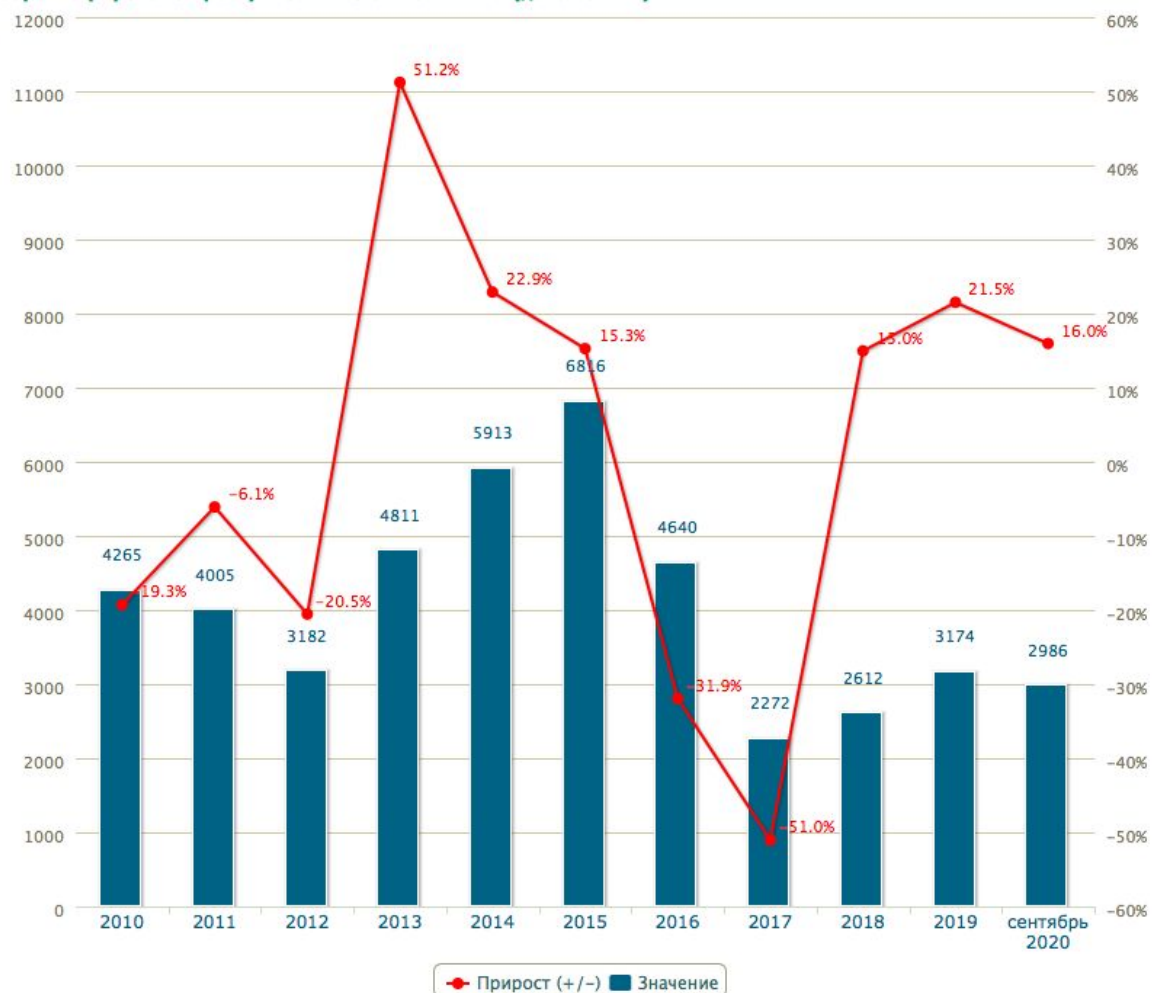
Зарегистрировано преступлений по ст. 291 УК РФ (дача взятки)