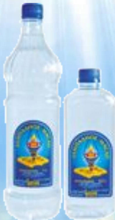
Вазелиновое лампадное масло