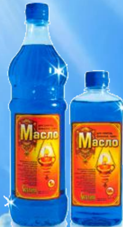
Парафиновое масло для лампад и факелов