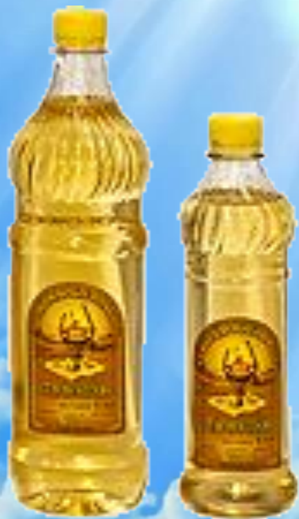
Рапсовое лампадное масло "Старорусское"

Миссионерский центр Светочь наладил производство лампадного масла высшего качества. Для снабжения монастырей и приходов Русской Православной Церкви.