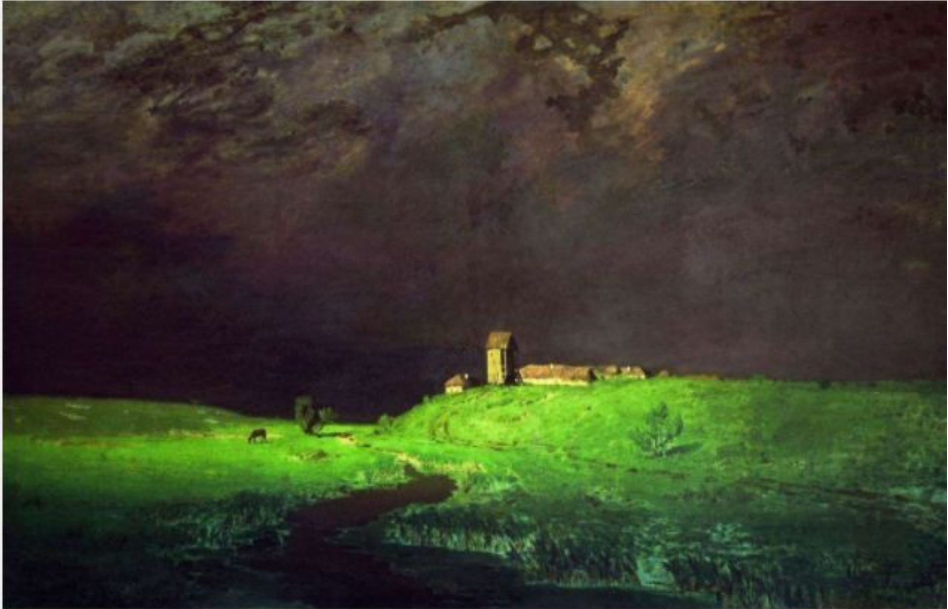
«После дождя» (Государственная Третьяковская галерея, Москва)