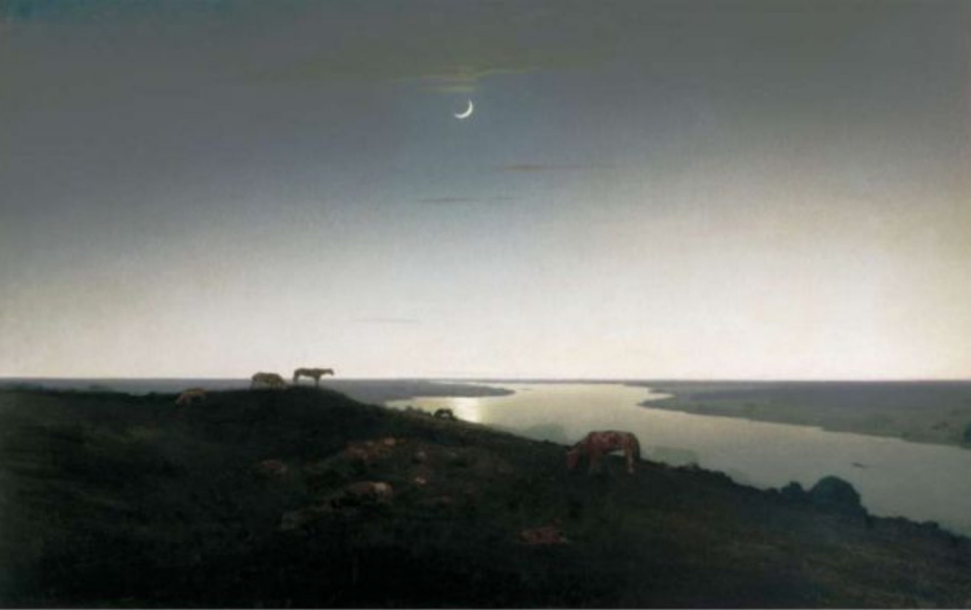
«Ночное», 1905—1908 (Государственный Русский музей, Санкт-Петербург)