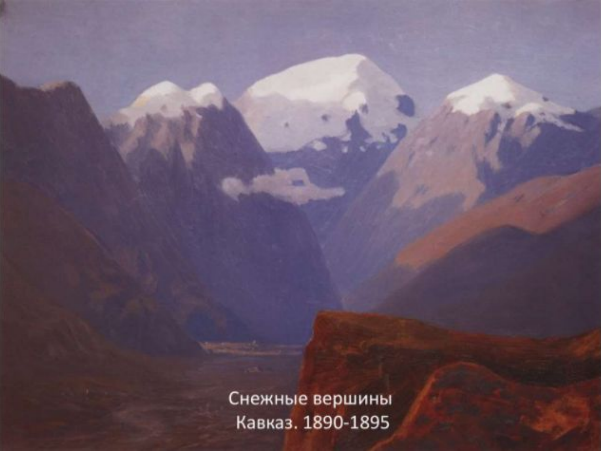
Снежные вершины Кавказ. 1890-1895