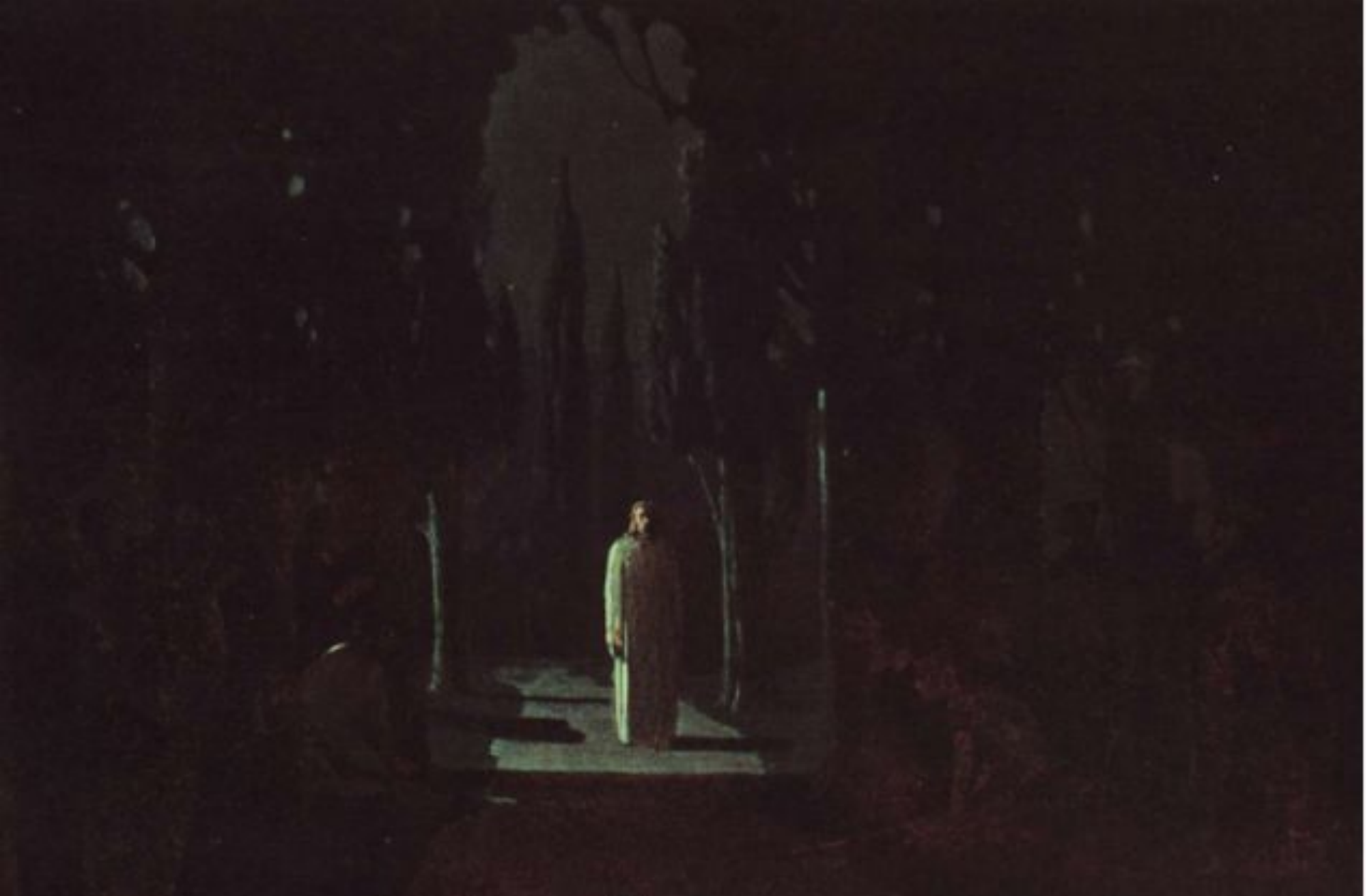
«Христос в Гефсиманском саду» (1901, Воронцовский дворец-музей, Алупка)