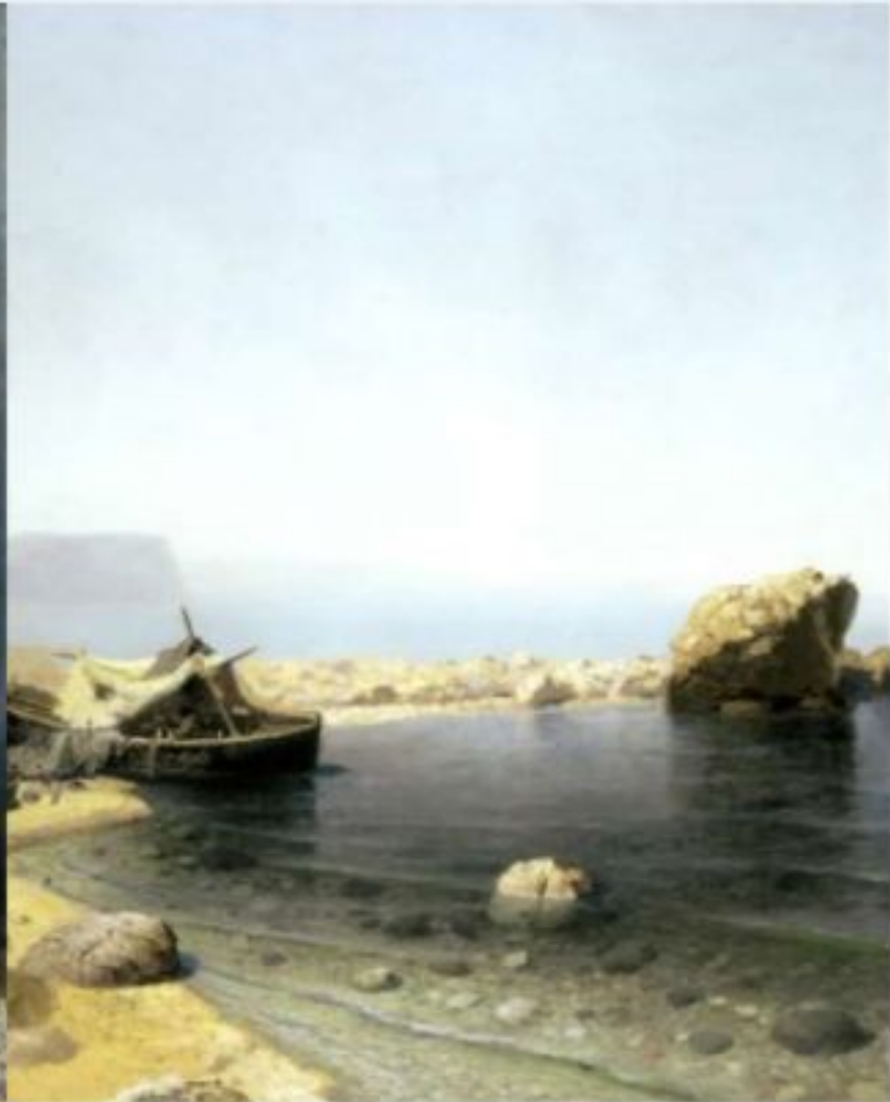
«Прозрачная вода» (Киевский национальный музей русского искусства)