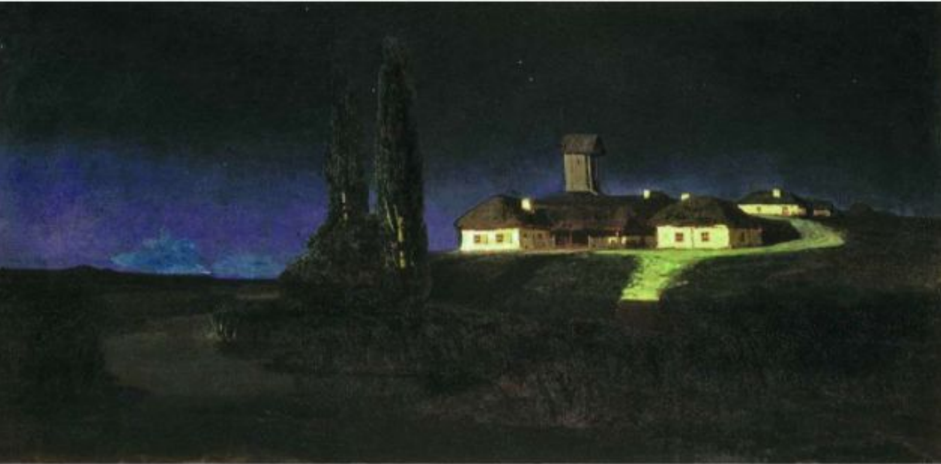
«Украинская ночь» (Государственная Третьяковская галерея, Москва)