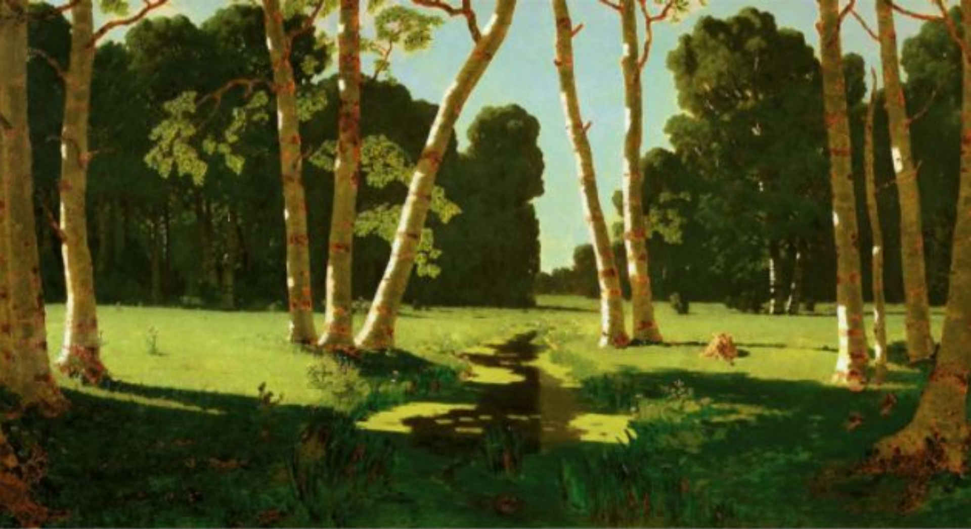
«Берёзовая роща» (Государственная Третьяковская галерея, Москва)