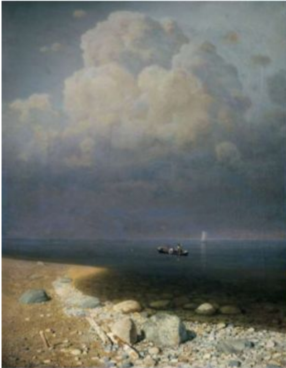
«Ладожское озеро» (Государственный Русский музей, Санкт-Петербург)