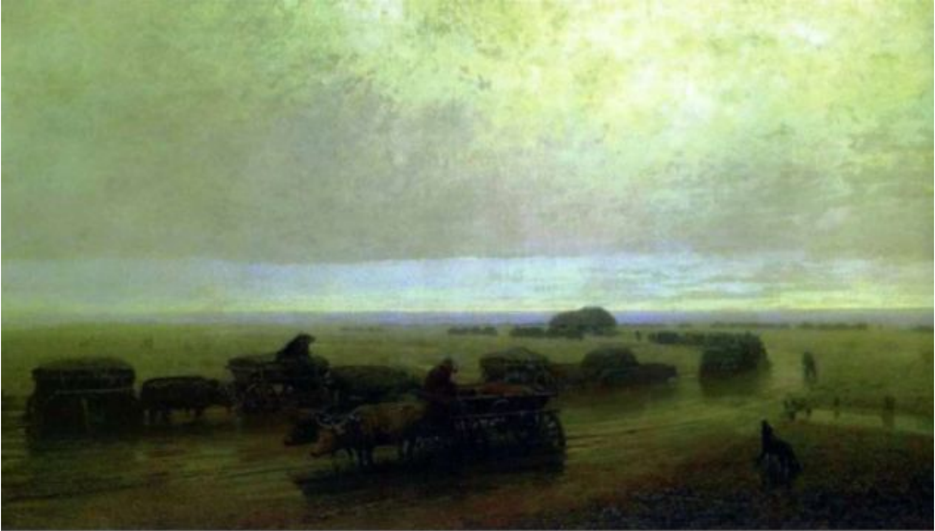
«Чумацкий тракт в Мариуполе» (1875, Государственная Третьяковская галерея, Москва)