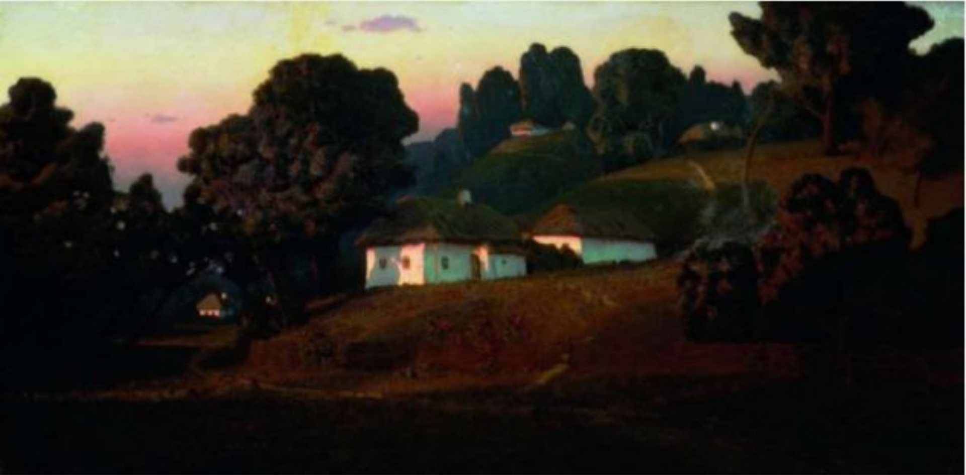
«Вечер на Украине» (Государственный Русский музей, Санкт-Петербург)