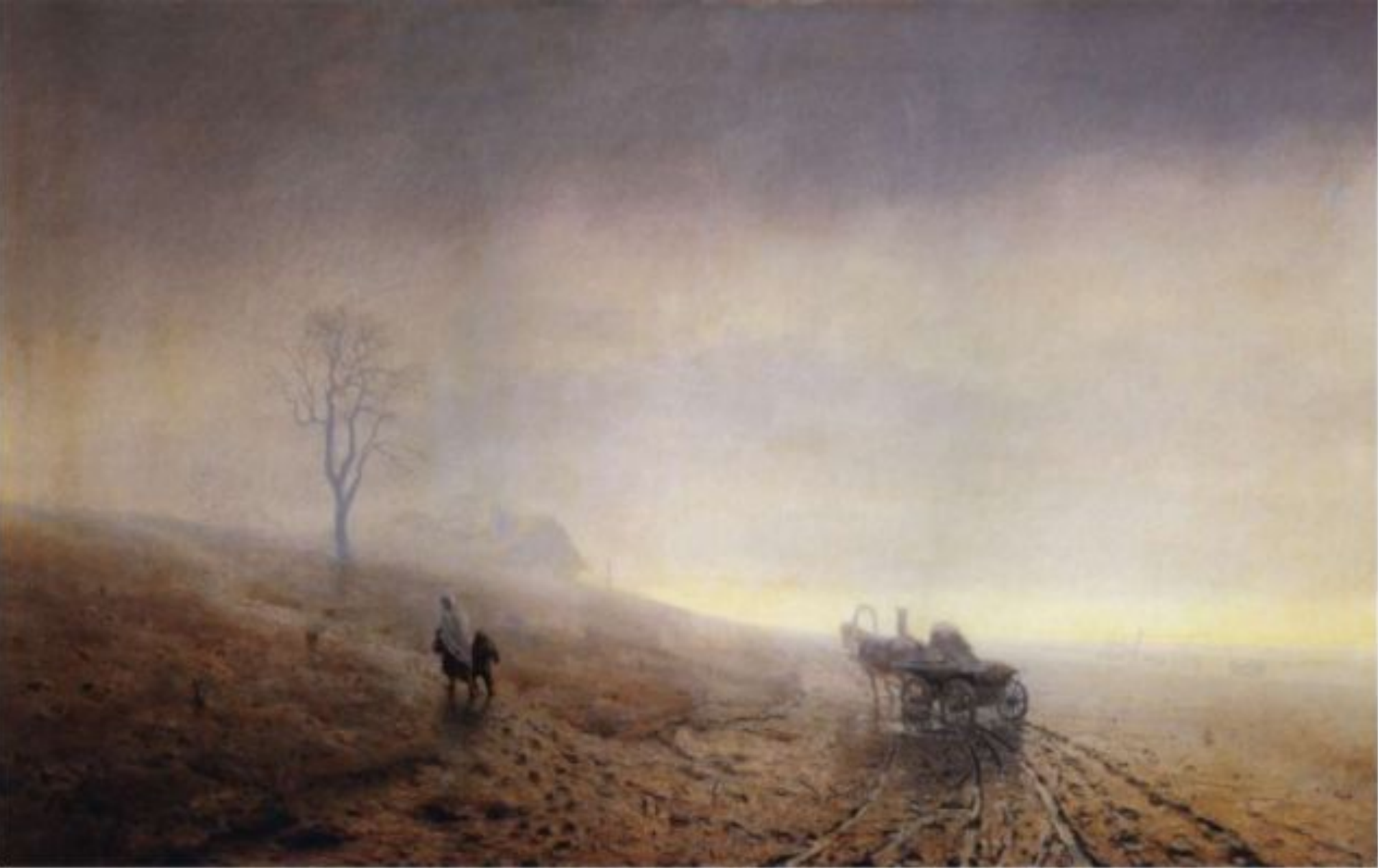
«Осенняя распутица» (1872, Государственный Русский музей, Санкт-Петербург)