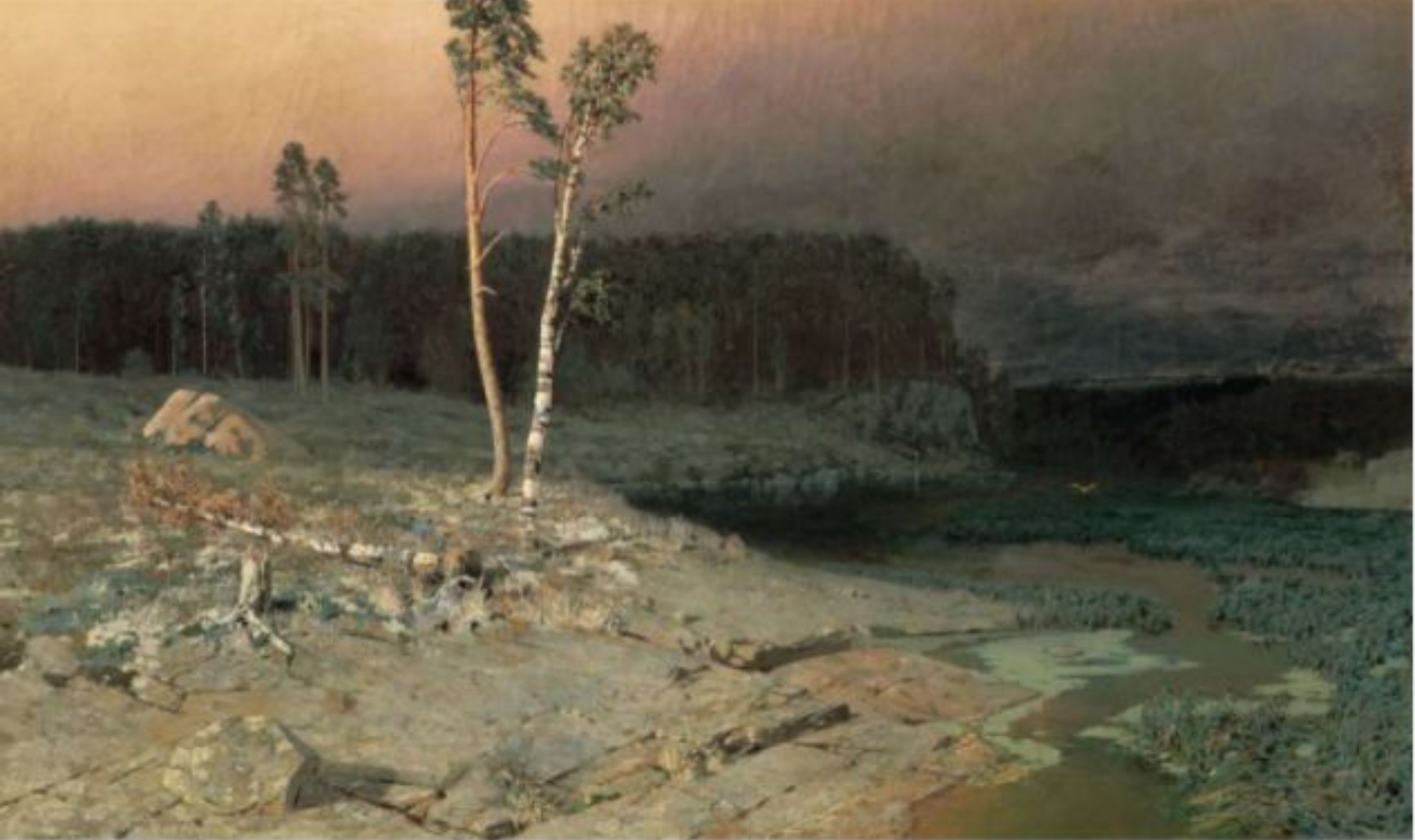
«На острове Валааме» (Государственная Третьяковская галерея, Москва)