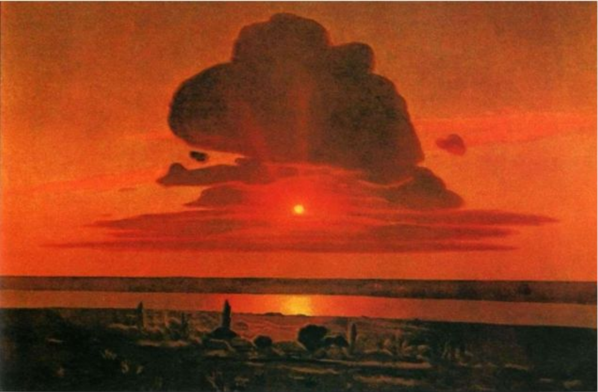
«Красный закат» (1905—1908, Метрополитен-музей, Нью-Йорк)