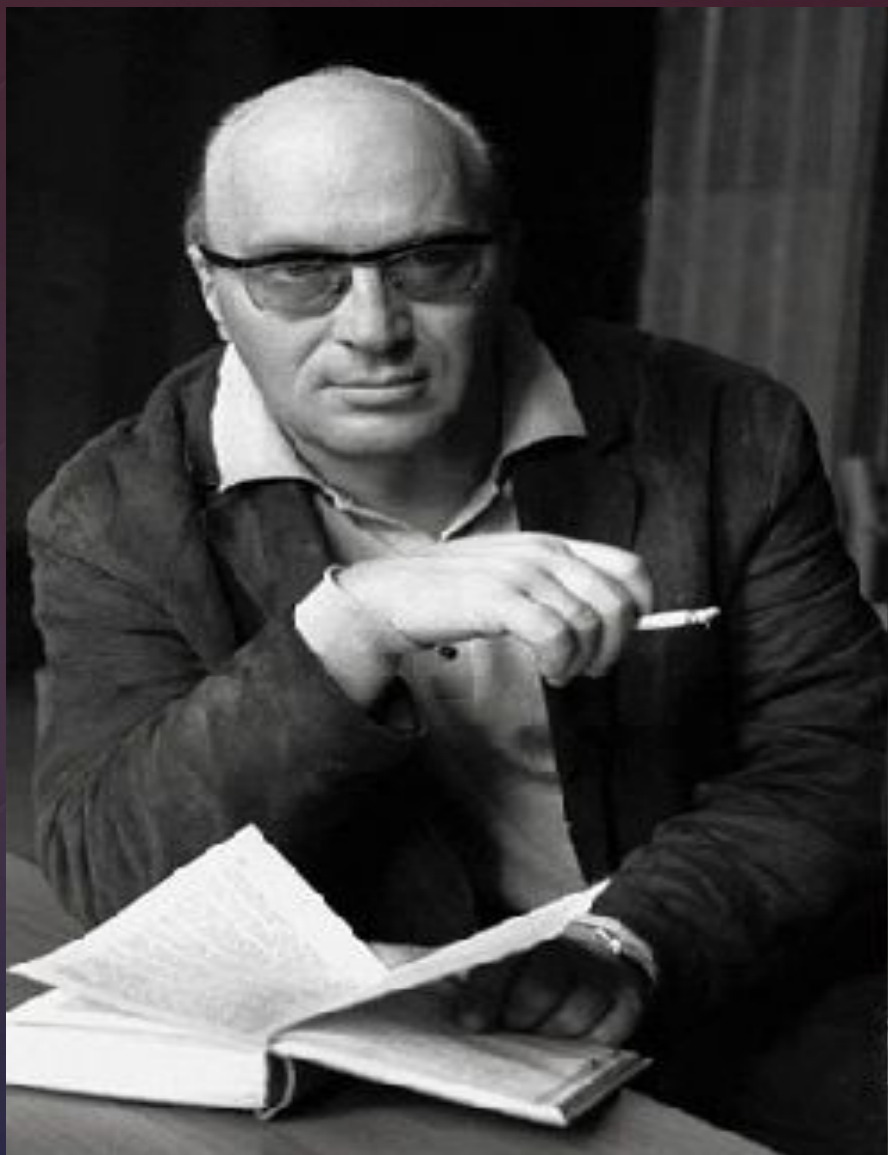
Юрий Казаков (1927-1982)