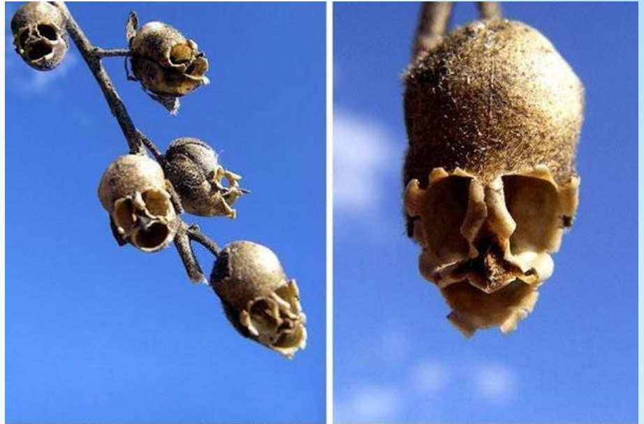
Семянка Львиного зева ( Antirrhinum )