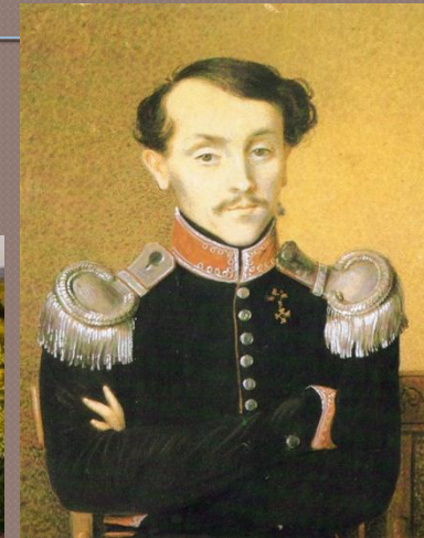
Н.И. Толстой, отец