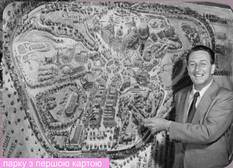
Створювач парку з першою картою «Діснейленду»