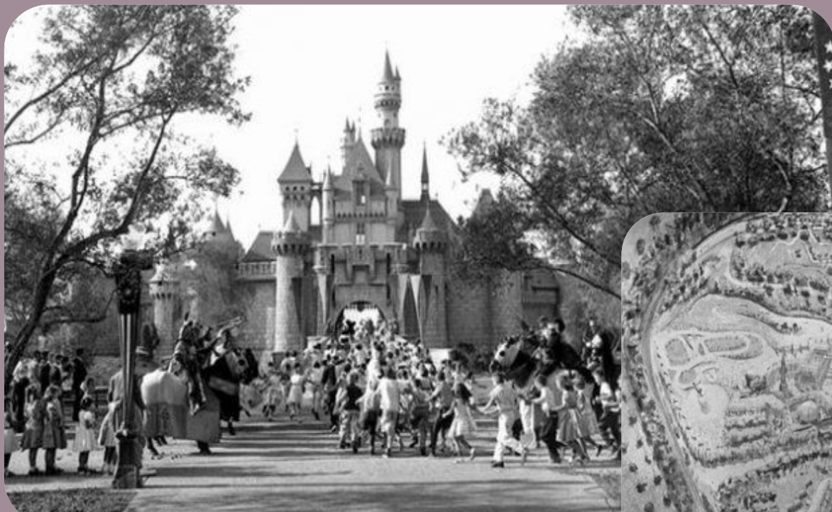
Перший парад у парку 1955 року