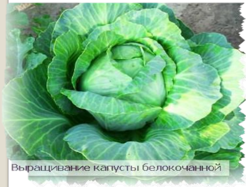
Выращивание капусты белокочанной

Ч еловек начал возделывать капусту более 5 тысяч лет назад, на что указывают данные археологических раскопок. Еще до новой эры это растение появилось в Древней Иберии, а впоследствии распространилось в Грецию, Египет, Рим.